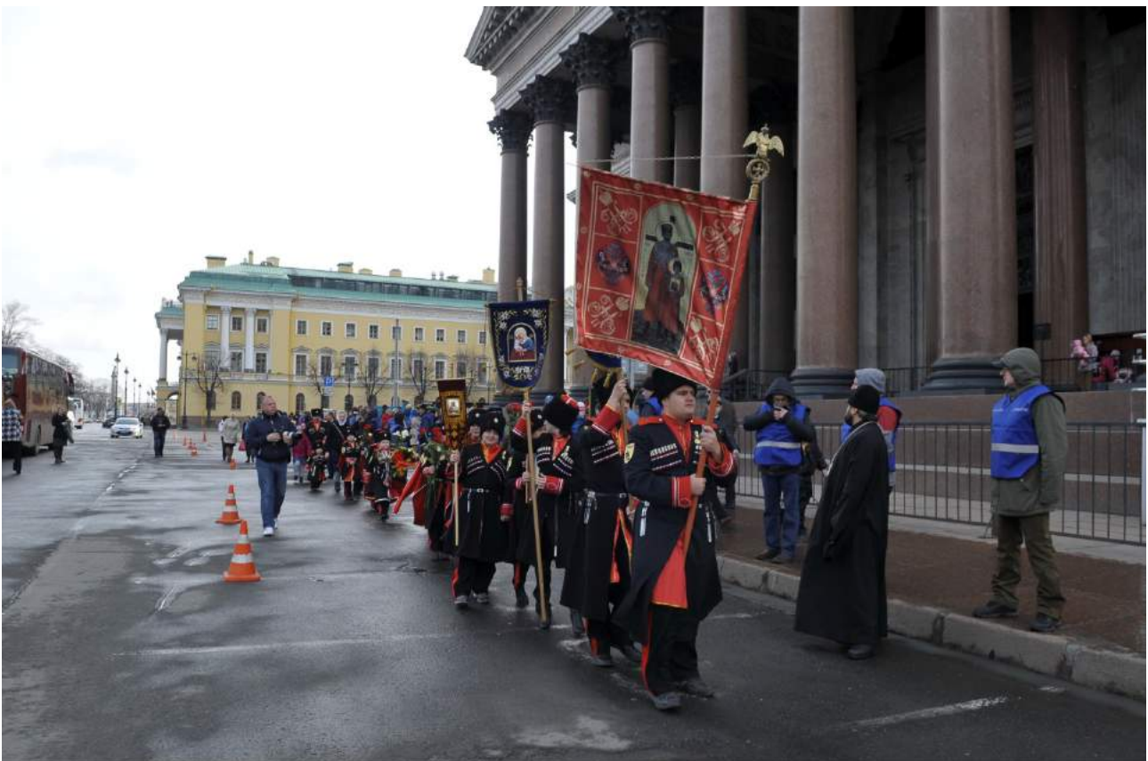
13 апреля 2014 года. Детский крестный ход в Петербурге на Вербное воскресенье