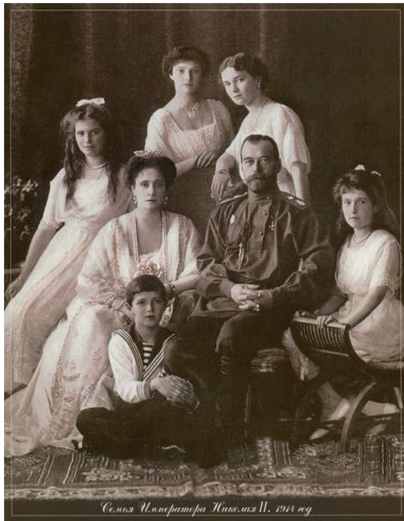
Семья Императора Николая II. 1914 год