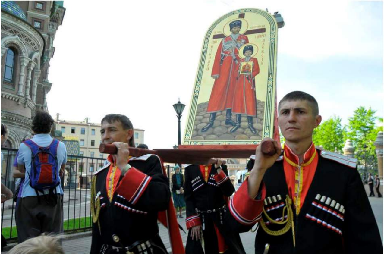
19 мая 2010 года состоялся Крестный ход у храма Спаса-на-Крови