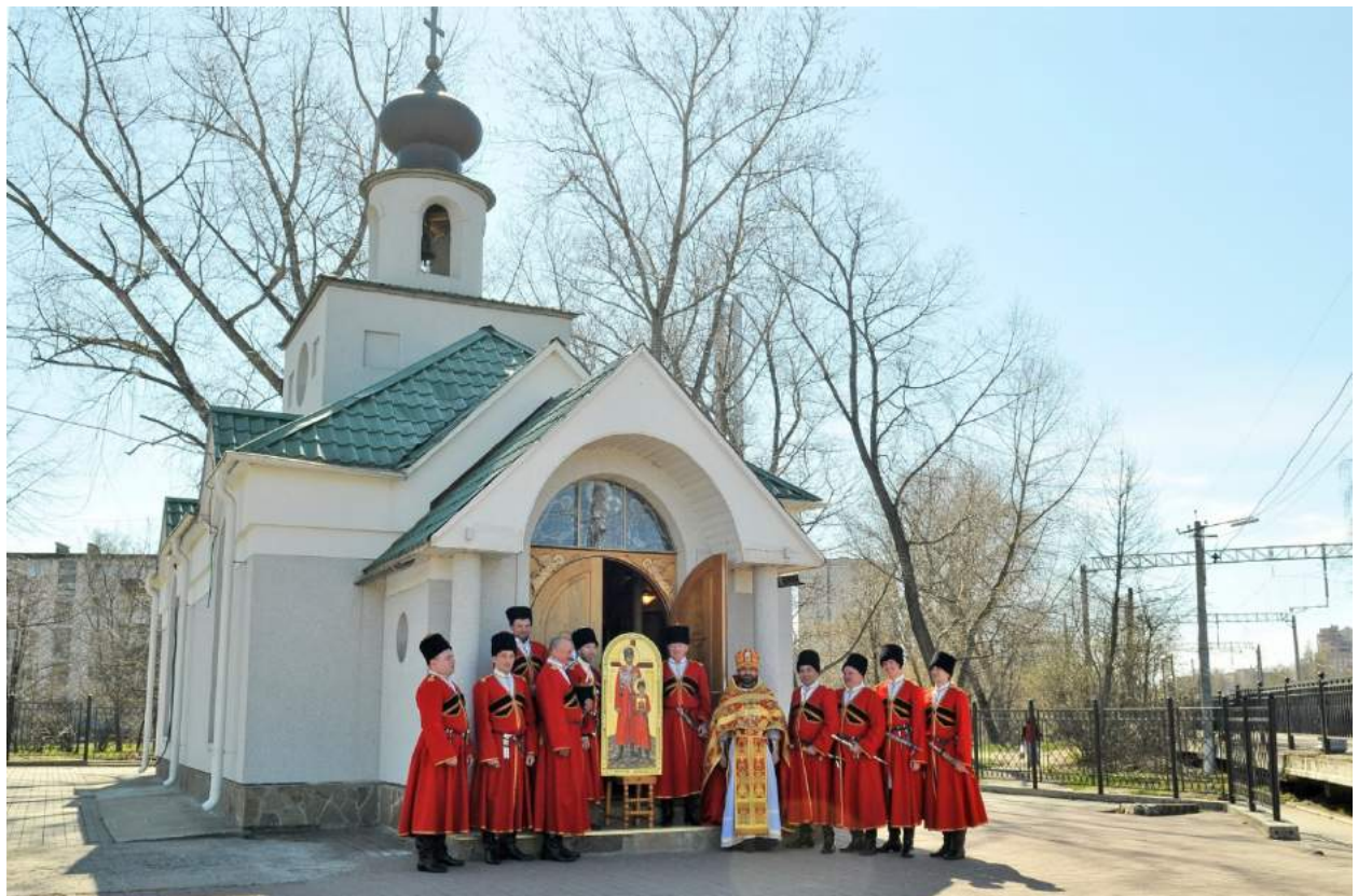
9 мая 2011 года - день основания Конвоя Святого Царя Страстотерпца