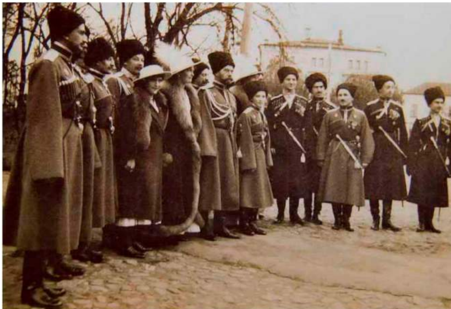
Николай II, его дочери и наследник цесаревич Алексей Николаевич с прошедшими испытательный срок новыми офицерами конвоя. Могилев. 1916 г.