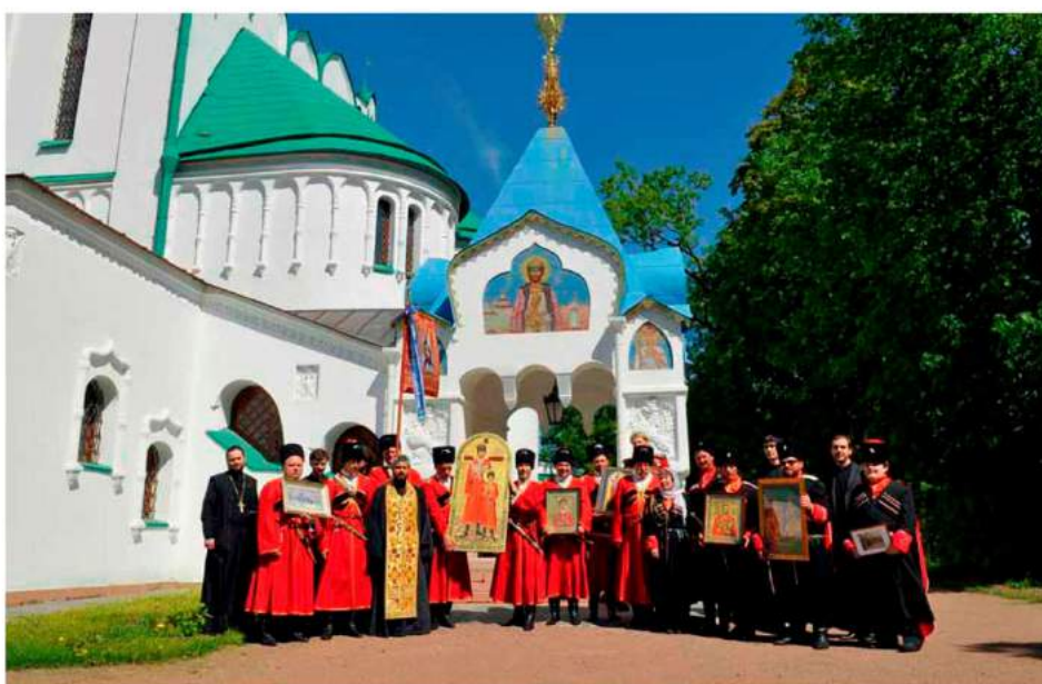
Казаки Конвоя Святого Царя Стратотерпца Николая II у Феодоровского собора, май 2011 года