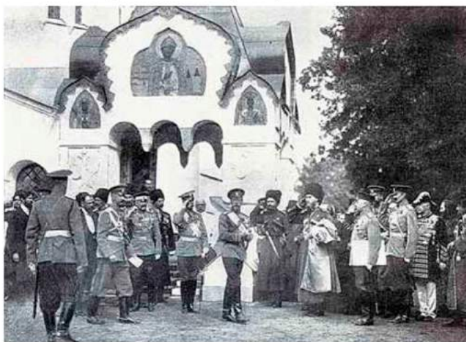
1912г. Феодоровский Государев собор