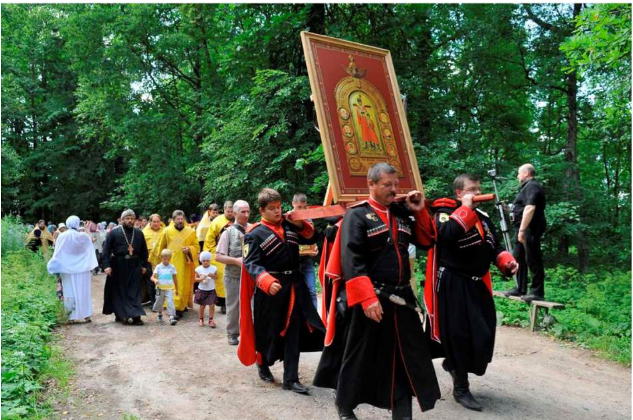
2013г. в Санкт-Петербурге состоялся ежегодный крестный ход «Царский путь»