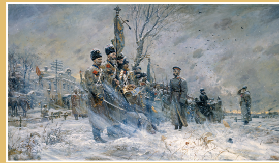
Присягая Государя с войсками. Худ. П. Рязанов