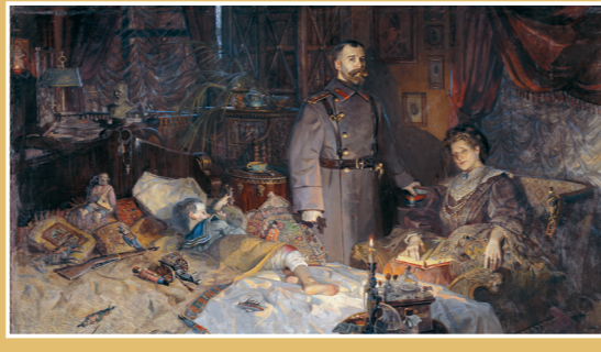
Зачинение в Царском Селе. Худ. П. Рязанов