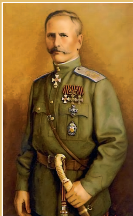
Портрет Ф. А. Коллер — рисунок, картина Царю до смерти

Искупительная жертва Государя была угодна Богу, подтверждением чего стало явление Державной иконы Божией Матери в день Его отречения.