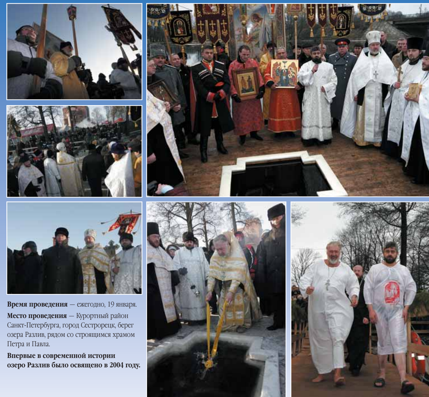
Время проведения — ежегодно, 19 января. Место проведения — Курортный район Санкт-Петербурга, город Сестрорецк, берег озера Разлив, рядом со строящимся храмом Петра и Павла. Впервые в современной истории озеро Разлив было освящено в 2004 году.