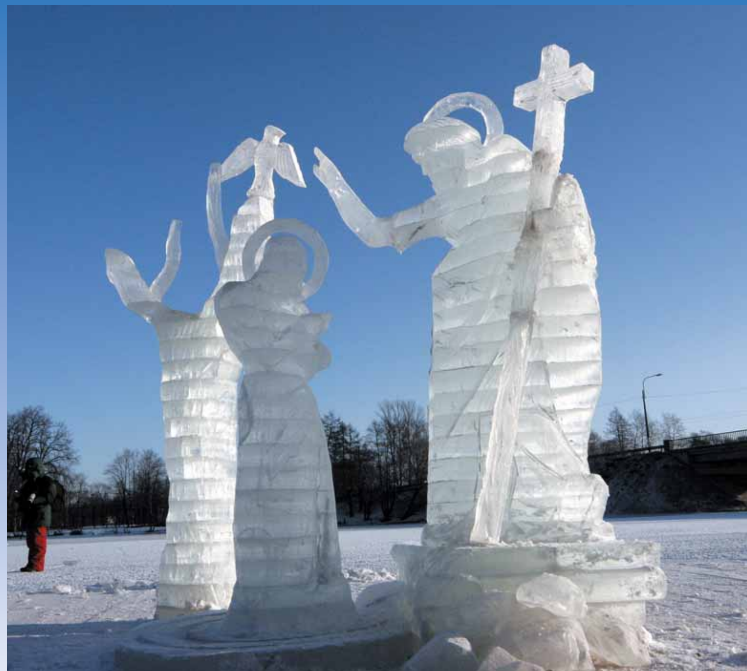
Духовно-просветительский центр Санкт-Петербург, г. Сестрорецк, ул. Воскова, д. 17. Тел. 973-26-42 www.sestroretsk.com