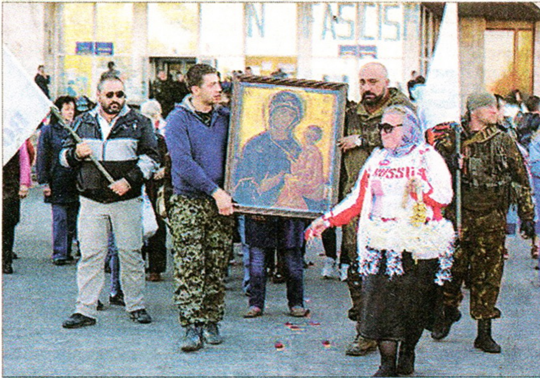
Тихвинская-Ополченнная икона Божьей Матери в Донецке

последние месяцы он очень много работал – нужно было подготовиться к 500-летию монастырского Успенского собора, который отмечается в нынешнем году, в июле, и считается днём рождения обители. Возможно, здоровье подкосили и неприятности, связанные с шумихой в СМИ вокруг так называемого Ополченного списка иконы Божией Матери «Тихвинская».