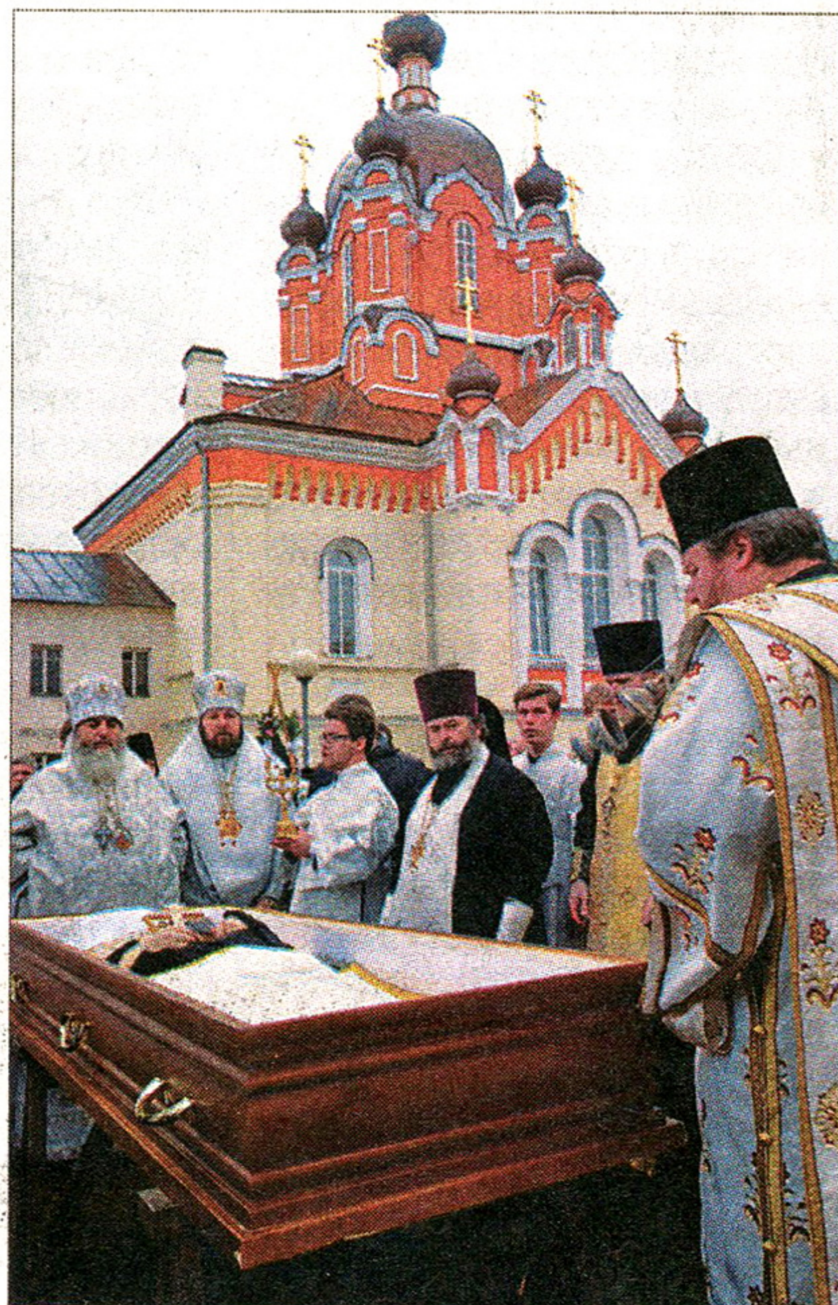
Тихвин. 7 марта