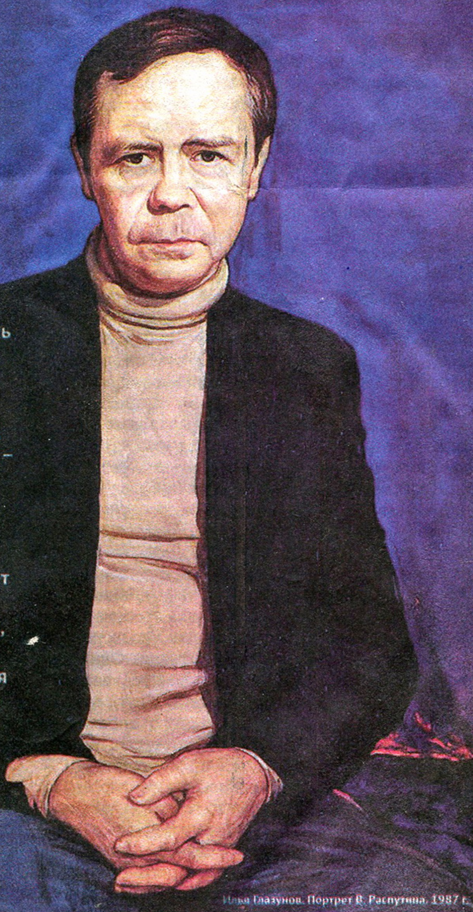
Илья Глазунов. Портрет В. Распутина. 1987 г.

Бог удостоил Валентина Распутина кончины «непостыдной, мирной»: за неделю перед кончиной он исповедался и причастился. «Он был настоящим художником слова, глубоко чувствующим самобытную красоту и силу русского национального духа. Всю свою жизнь писатель посвятил служению непреходящей истине, которую обрёл в Православной Церкви, став её верным сыном», – сказал о нём на отпевании Святейший Патриарх. О писателе и его роли в Отечестве размышляет в «Хронографе» Михаил Сизов (на стр. 2), а в «Вертограде» читайте рассказ писателя «Что передать вороне?» (стр. 21–23).