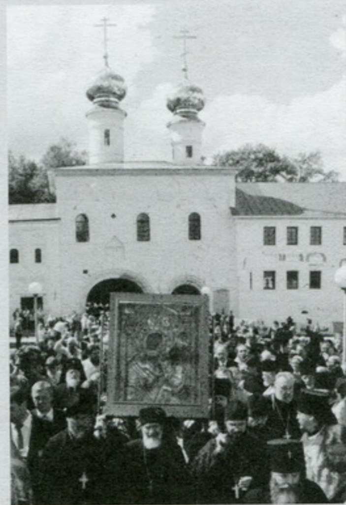
Святыня возвратилась в свой Дом. Тихвинский Богородичный Успенский мужской монастырь. 8 июля 2004 г.

Идея выпуска серии книг, названной нами "Тихвинский небесный глобус" появилась у издательства "под давлением общественности". Многочисленные паломники и туристы, приезжающие в Тихвин, чтобы поклониться вернувшейся из странствий Святыне – Тихвинской Чудотворно-явленной иконе Божией Матери, невзначай подсказали сами эту идею. В Тихвин приезжают сегодня не только россияне, но и люди всех стран и континентов. Их пути проходят через разные города и населённые пункты, имеющую свою историю и свои достопримечательности. Рассматриваемые в связи друг с другом, они представляют собой историю России, её духовную и материальную культуру. Но путешественники подчас не знают, какие чудеса, исторические факты и памятники культуры встречаются им по дороге в Тихвин. А что если сделать такую серию книг, кото-