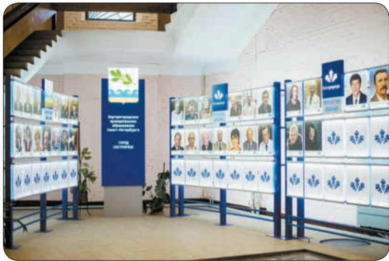
В холле Муниципального совета города Сестрорецка по адресу: Приморское шоссе, дом 280 была торжественно открыта галерея портретов Почётных жителей.

Это почётное звание Муниципальный совет города Сестрорецка ежегодно присваивает с 2004 года. За 11 лет звания были удостоены 32 человека, среди них – ветераны