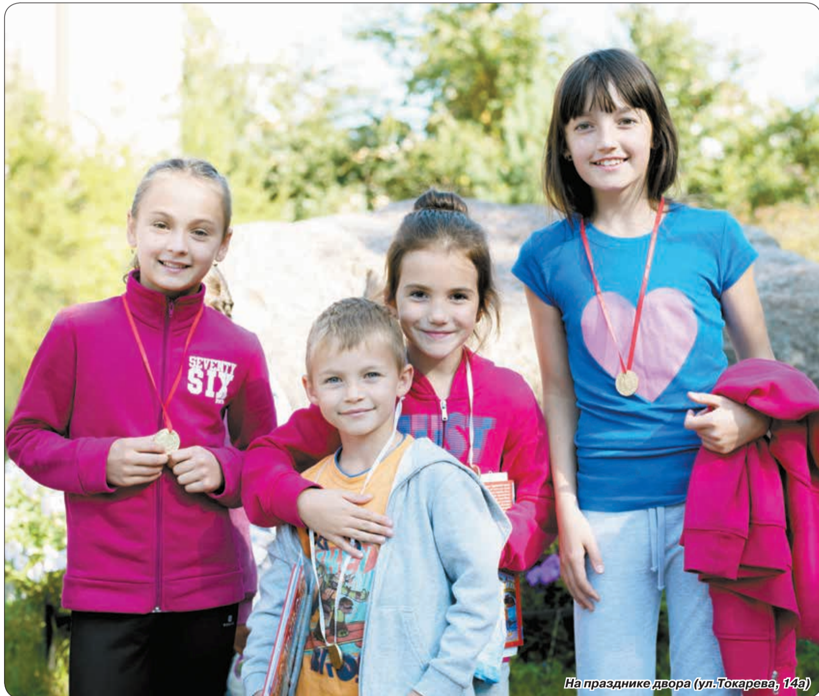
На празднике двора (ул.Токарева, 14а)