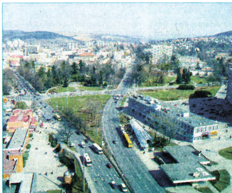
■ Это - Злин. Города наши выглядят по-разному. А проблемы случаются одинаковые