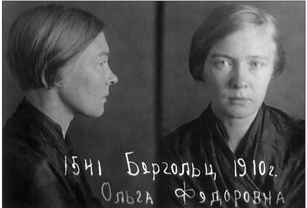
14 декабря 1938 г. Фотографии из архивного следственного дела № П-8870. (Архив Управления Федеральной службы безопасности по Санкт-Петербургу и Ленинградской области.)