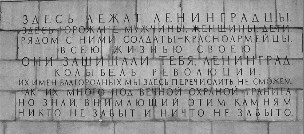
9 мая 2010 года исполнится 50 лет со дня открытия Пискаревского мемориала. На одной из стен выбиты стихи Ольги Берггольц, посвященные лавшим ленинградцам.

В течение многих месяцев она не раз возвращается к тому, что пережила за месяцы заключения. В тюрьме, в апреле 1939 года, она потеряла ребенка. До этого, еще раньше, умерли в детском возрасте две ее дочери. В 1937 году первый муж Ольги Берггольц поэт Борис Корнилов, с которым, правда, они были уже в разводе, был расстрелян. Его стихи «Нас утро встречает прохладой, нас ветром встречает река...» положил на музыку Д. Шостакович.