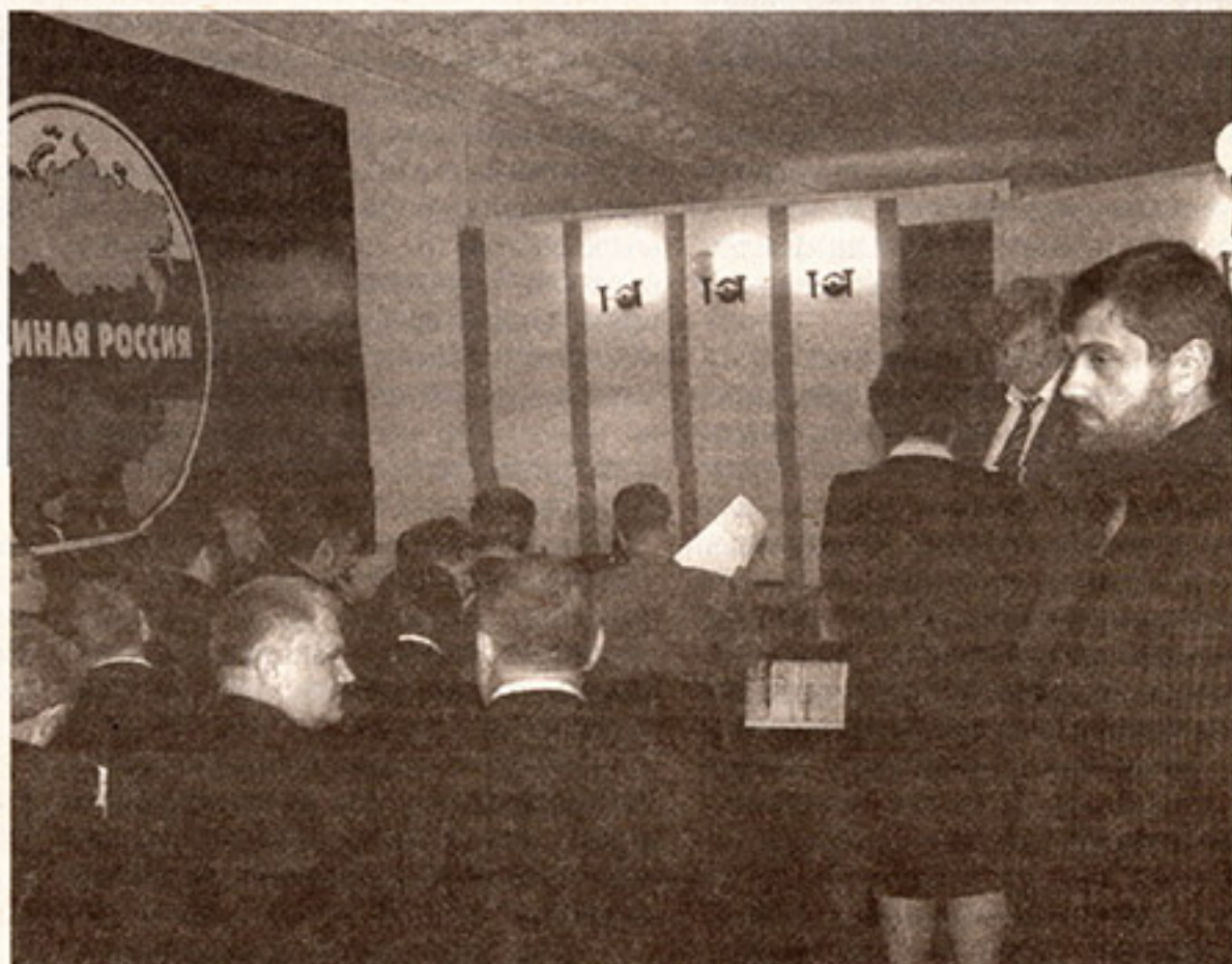
На заседании регионального политсовета партии «Единая Россия»