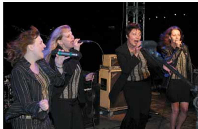
Вокальный коллектив «ФРЕСКО» — I премия