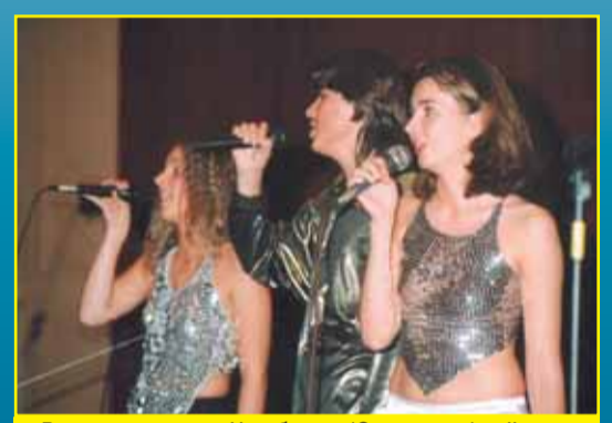
Вокальная группа «Незабудки» (Сестрорецк) — II премия