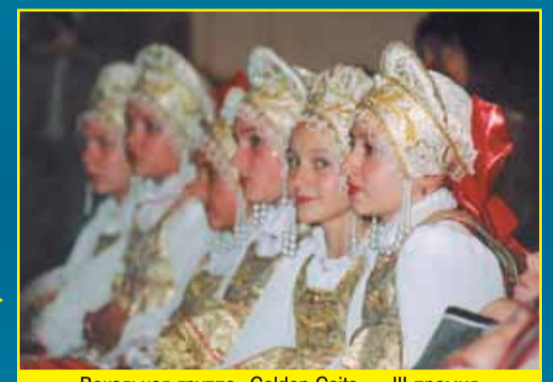
Вокальная группа «Golden Gaits» — III премия