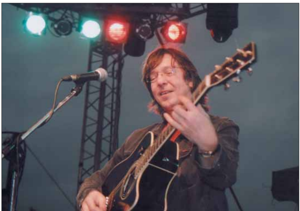
Почетные гости фестиваля «Берега» — Игорь КОРНЕЛЮК и группа «СЕКРЕТ» на гала-концерте