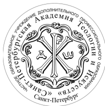
САНКТ-ПЕТЕРБУРГСКАЯ АКАДЕМИЯ ТЕОЛОГИИ И ИСКУССТВ