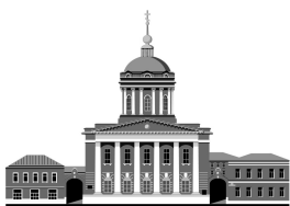
Российский Православный Университет

При реализации проекта используются средства государственной поддержки, выделенные в качестве гранта в соответствии с распоряжением Президента Российской Федерации от № 79-рп 01.04.2015 и на основании конкурса, проведенного Общероссийской общественной организацией «Союз пенсионеров России».