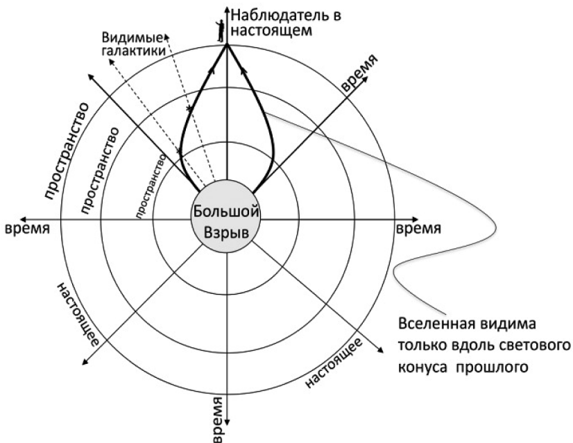
Рис. 1. Единство вселенной как происходящее из Большого взрыва

Современная космология утверждает тотальность вселенной не как sum total ее частей, а как то отдаленное в прошлом состояние, интерпретируемое как «начало» (то есть космологическая сингулярность или Большой взрыв), из которого вселенная происходит. О целостности вселенной можно с ответственностью рассуждать, только апеллируя к Большому взрыву, ибо только в непосредственной близости к последнему, согласно теории, можно потенциально было бы «иметь доступ» к вселенной в ее целостности. Действительно, видимая часть вселенной образует незначительную часть вселенной как целого, соотносясь с этим целым только через общее происхождение в Большом взрыве. Графически последнее может быть проиллюстрировано с помощью диаграммы, на которой видимая вселенная представлена кривой, имеющей форму луковичи, в то время как остальная часть круга представляет собой вселенную, невидимую для нас (рис. 1):