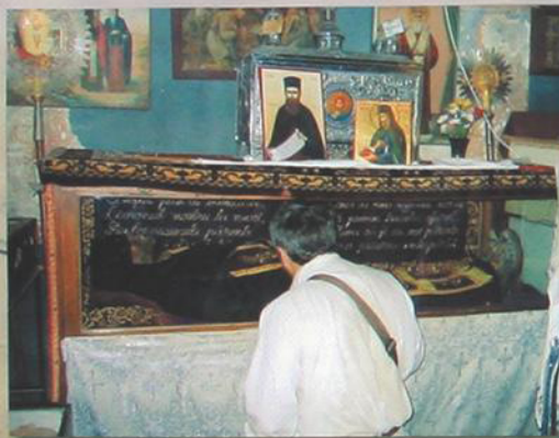
У мощей св. Георгия Хозевита