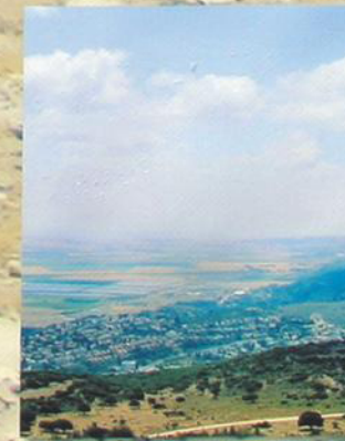
Галилея. Гора Кармил.