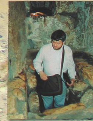
Гробница Лазаря Четверодневного