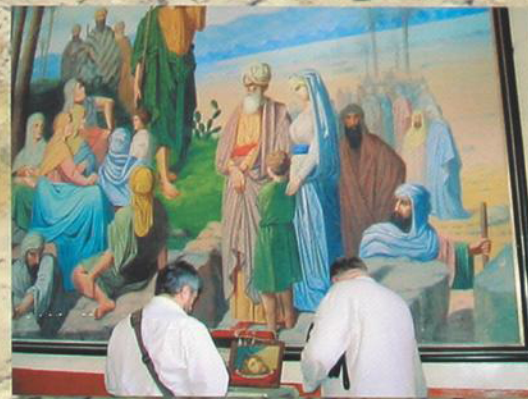
Молитва в монастыре