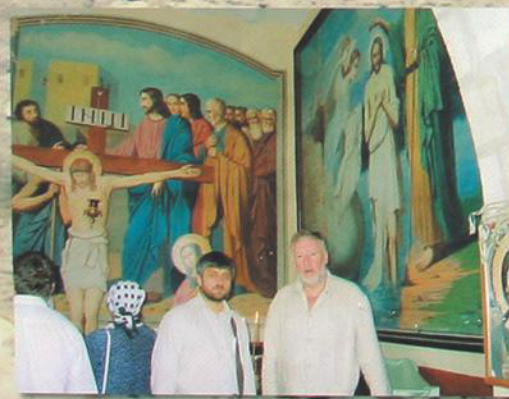
Монастырь Крестителя Господня Иоанна