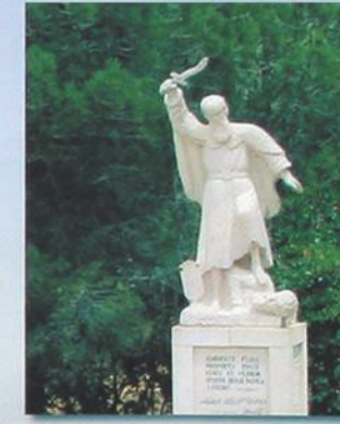
Изваяние Георгия Хозевита