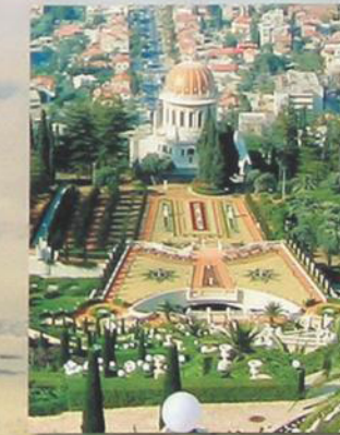
Храм у подножья горы Кармил