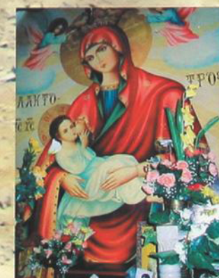
Икона Божией Матери Млекопитательницы в монастыре св. Герасима Иорданского