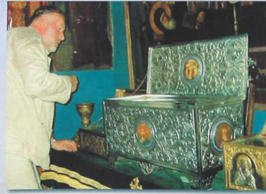
В монастырском храме