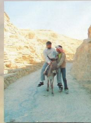
Дорога к храму