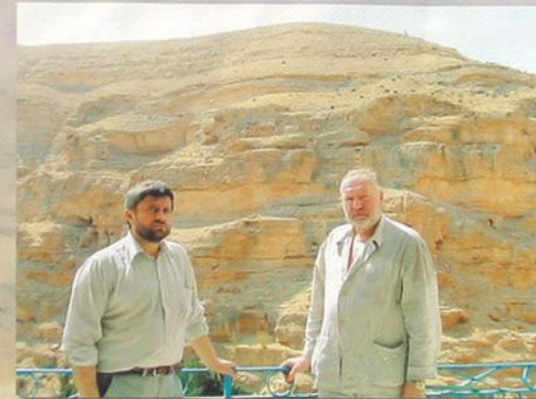
На подступах к Иудейской пустыне