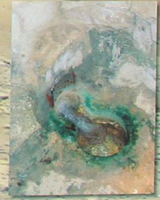
Источник Божией Матери в Назарете