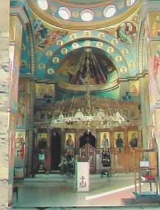
В храме Архангела Гавриила