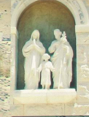
Святое семейство на фасаде храма Архангела Гавриила