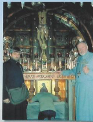
У иконостаса в храме на Голгофе