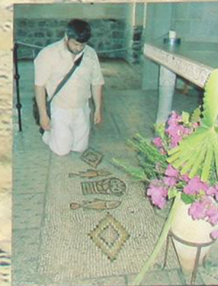
Мозаичное изображение "Умощение хлебов".