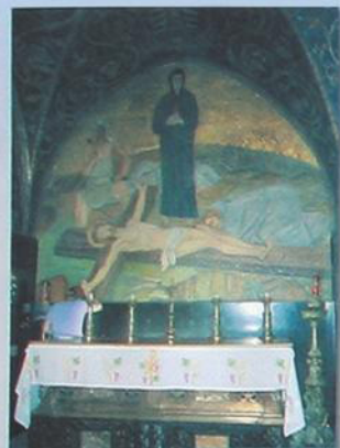
В храме на Голгофе

По преданию, Святая царица Елена, мать императора Константина Великого, в 325 году отправилась в паломничество в Иерусалим с целью отыскать крест, на котором был распят Господь, и место Его погребения. Так паломничество стало христианской формой поклонения Господу. С тех пор ежегодно 14 (27) сентября христиане поклоняются Животворящему Кресту Господню, выражая готовность нести свой крест, доверяясь Божьей воле.