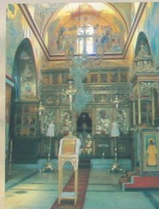
Храм на Фаворе