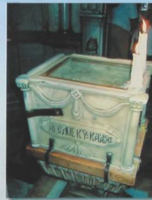
Кувуклия (часовенка Гроба Господня)