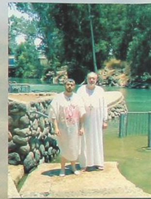
На берегу Иордана