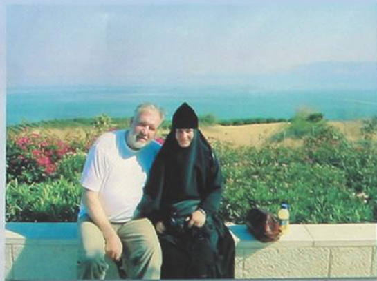
На Горе Блаженств