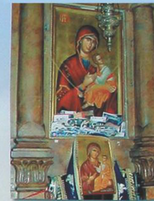
Образ Богородицы в Храме 12 апостолов.