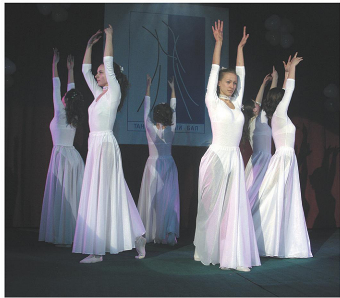
«Ритм» — совместный проект школы №466 и подросткового клуба «Молодость» поселка Песочный — с танцем «Нежность» стал победителем в номинации «За артистизм исполнения».