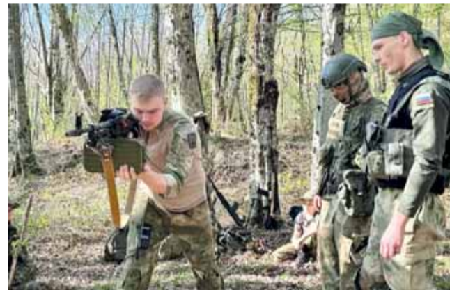
Серьезное внимание в Черноморском казачьем округе Кубанского казачьего войска уделяется боевой подготовке казаков.