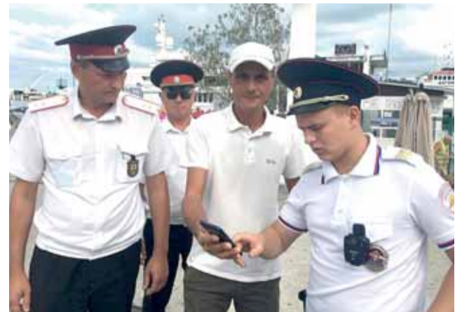
Казаки-дружинники постоянно занимаются охраной общественного порядка на набережных, улицах, в парках Сочи. На дежурства они выходят вместе с сотрудниками полиции.