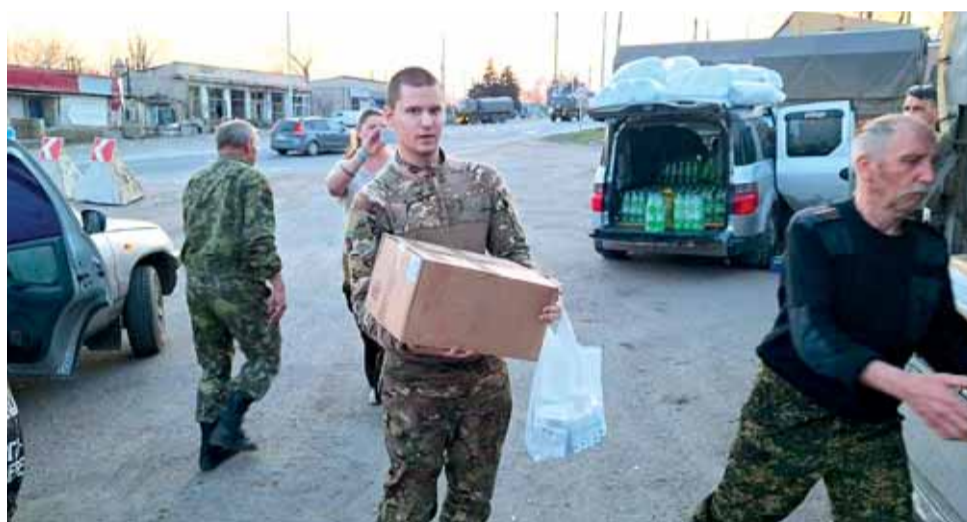
Собранные казаками Черноморского казачьего округа посылки регулярно доставляются участникам боев в Донбассе и Новороссии.

В начале 90-х годов отношение к возрождению казачества в Сочи было, мягко говоря, прохладным. Потомственных казаков среди жителей приморского города немного, зато хватало мошенников, лихо щеголявших в бекешах и черкесах по городским улицам. Однако в августе 1992 года общественное мнение Сочи перевернулось в один миг. За пограничной рекой Псоу, на территории Абхазии, загремели выстрелы, сюда вторглись боевые отряды грузинских националистов «Мхедриони» и «Белый легион». Иногда банды бывших грузинских уголовников совершали грабительские набеги на села российского берега, поскольку Кубанского пограничного отряда еще не существовало. Но вскоре такие вылазки прекратились: в районе сел Веселое, Гумария, Ермо-