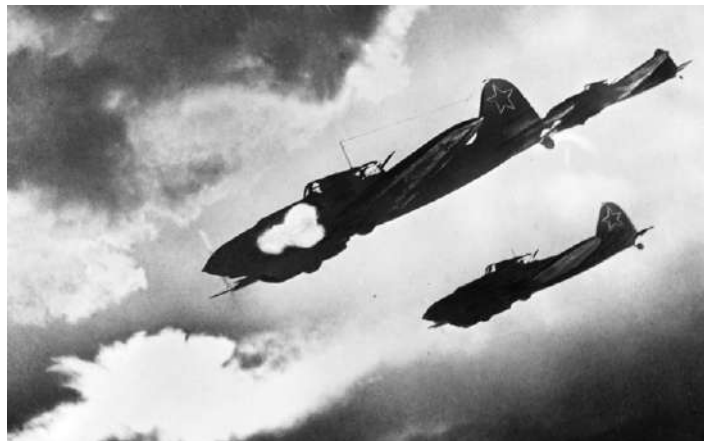
Советские лётчики на самолётах ИЛ-2 атакуют колонну противника.

Именно на ударную мощь новых бронированных машин вермахта (которые начали разрабатываться в Германии после встречи с советскими танками Т-34 и КВ) надеялся Гитлер летом 1943 года. Советскому командованию удалось захватить образец танка «Тигр», изучить его и начать разработку рекомендаций, каким образом с ним лучше бороться на поле боя. Однако новых самоходных советских орудий (СУ-152), которые на равных могли соперничать с новыми немецкими танками, пока на фронте было явно недостаточно. Т-34-85, калибр орудия которого был уже 85 мм, появился в Красной Армии только в начале 1944 года. В результате новые немецкие танки могли поражать советские «тридцатьчетвёрки» с расстояния 1,5–2 километра, тогда как советские орудия Т-34 могли пробить броню танков «Тигр» и «Пантера» (причём в основном бортовую броню) только с расстояния 300–400 метра.