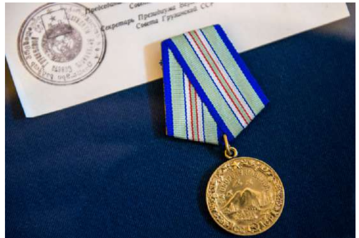
Медаль «За оборону Кавказа».

Победа Красной Армии в битве за Кавказ имела огромное значение для всего хода Великой Отечественной войны. Нацистским войскам не удалось захватить главные советские нефтяные месторождения, враг не получил ресурсов, необходимых ему для ведения дальнейшей наступательной войны. Победы под Сталинградом и в битве за Кавказ наглядно показали, что в войне произошёл решительный перелом.