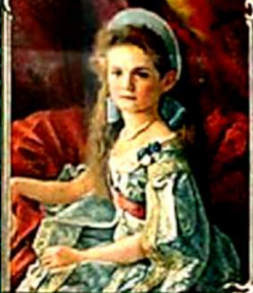
Великая Княгиня Ольга Александровна, Великая Княжна Ольга Александровна