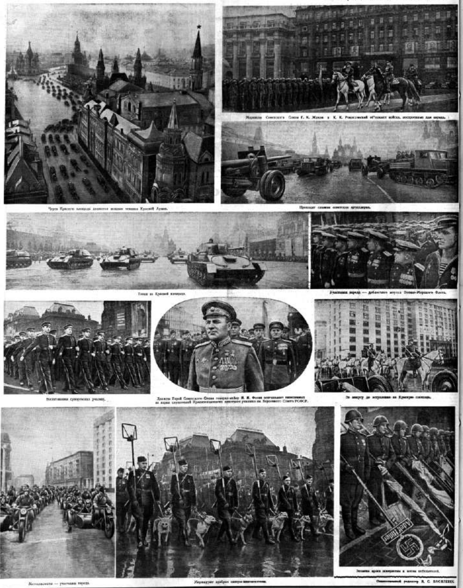
ИСТОРИЧЕСКИЙ ПАРАД ПОБЕДЫ НА КРАСНОЙ ПЛОЩАДИ.