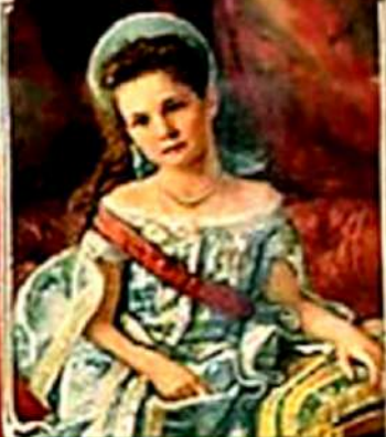
Великая Княгиня Татьяна Александровна, Великая Княжна Татьяна Александровна