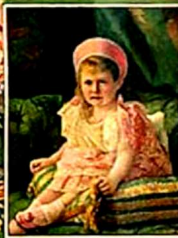
Великая Княгиня Анастасия Александровна, Великая Княжна Анастасия Александровна