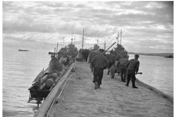
Десант морской пехоты готовится к высадке в районе Новороссийска. Февраль 1943 года.

К 9 октября 1943 года территория Кавказского региона была освобождена. Создались предпосылки для высадки десанта на Керченском полуострове и освобождения Крыма.