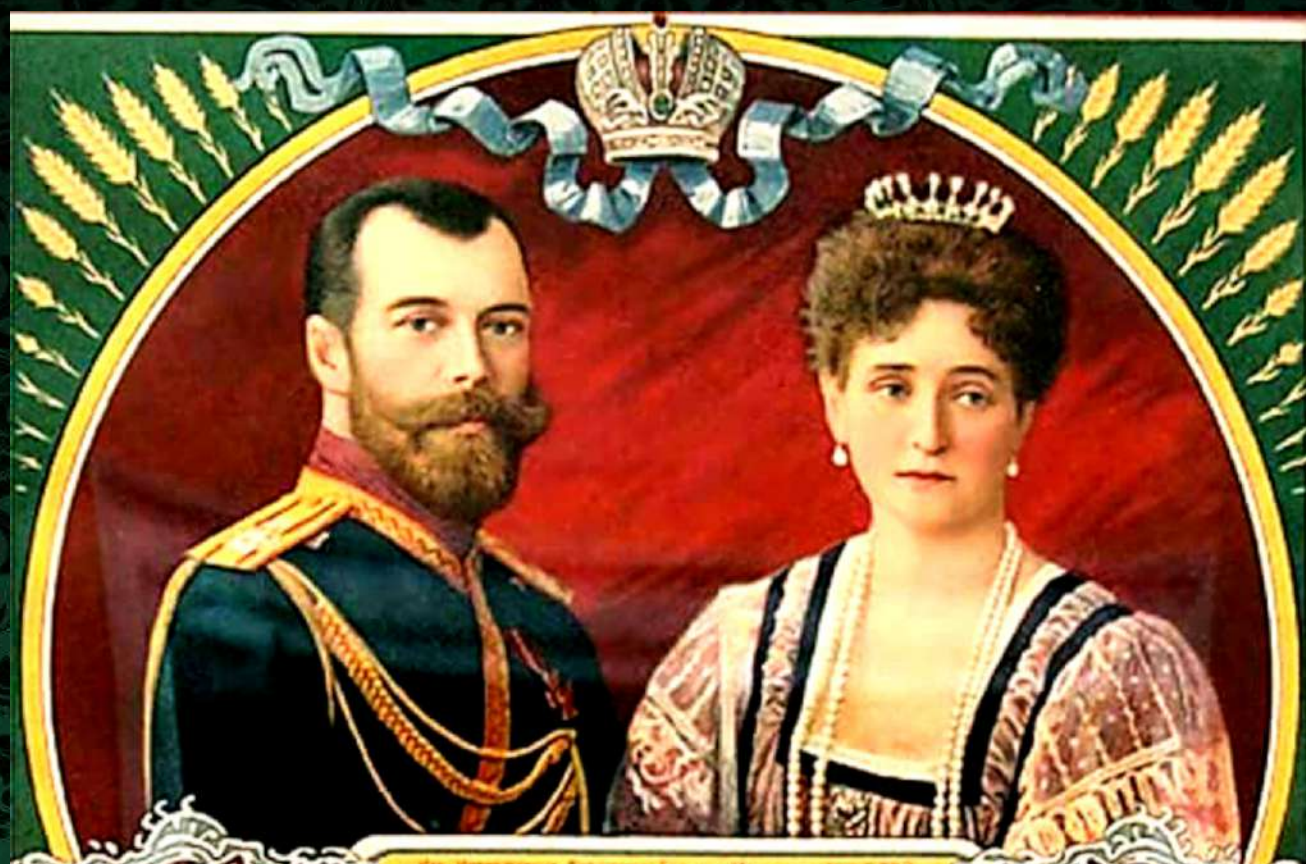
Императоръ Александръ Александровичъ, Императрица Мария Александровна, Великая Княгиня Александровна Александровна, Императоръ Николай Александровичъ