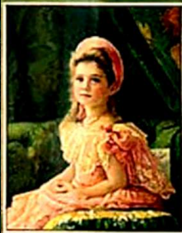
Великая Княгиня Александра Александровна, Великая Княжна Александра Александровна