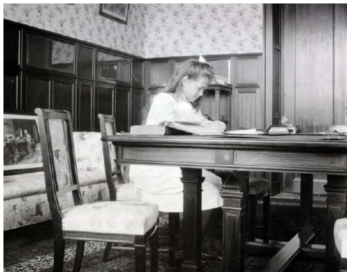
Великая княжна Мария Николаевна Романова