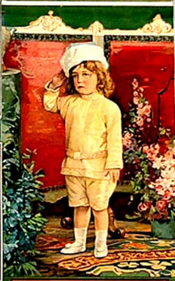
Великий Князь Николай Александрович, Великий Князь Николай Александрович