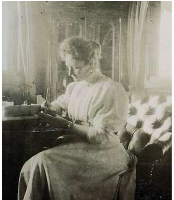
Императрица Александра Федоровна

Избранные письма Императрицы Александры Федоровны к ее дочери, Великой Княжне Марии Николаевне