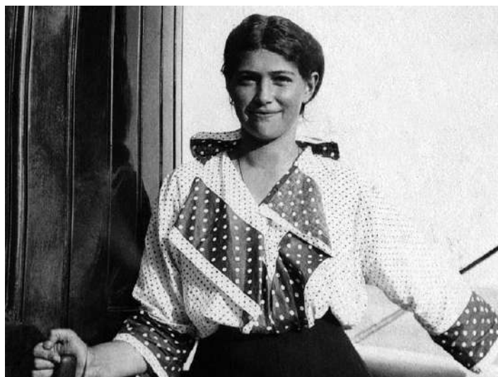
Великая княжна Мария Николаевна Романова