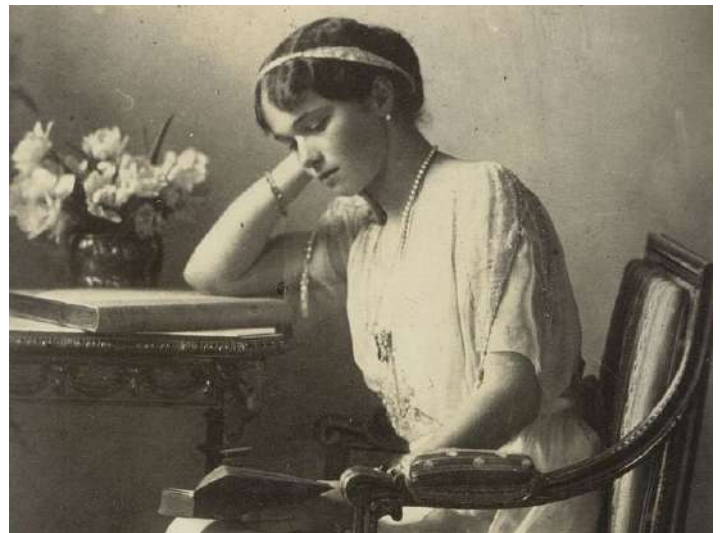
Великая Княжна Ольга Николаевна