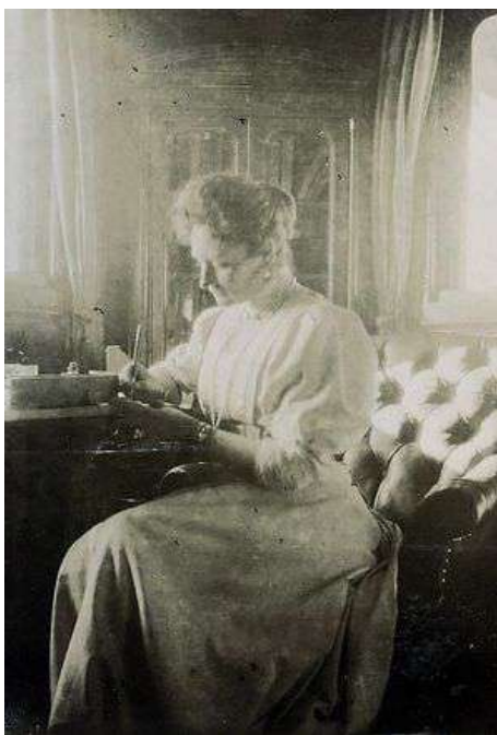
Императрица Александра Федоровна

Когда началась Первая мировая война, Великие