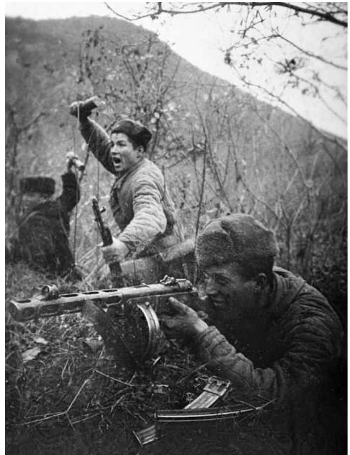
Морские пехотинцы в боях под Туапсе. Сентябрь 1942 года.

Из воспоминаний Маршала Советского Союза А. А. Гречко.