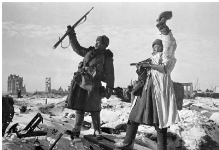
Сталинград, 31 января 1943 года.

У. Черчилль в телеграмме И. Сталину, от 11 марта 1943 года.