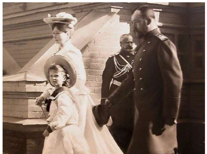
Император Николай II, императрица Александра Федоровна и великая княжна Ольга Николаевна у входа в монастырь Спасов Скит