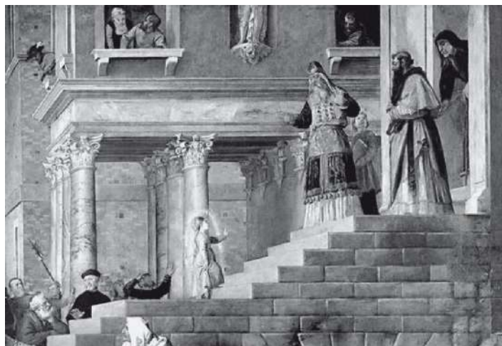
Введение во храм Пресвятой Богородицы. Худ. Тициан, ок. 1534

Родители Марии, Иоаким и Анна, исполнив свой обет, возвратились домой. Мария жила при Храме вместе с другими девочками. Старшие обучали ее чтению, письму и женским рукоделиям. Маленькая Мария выучилась прясть блестящие льняные нити и тонкую шерсть и вышивать цветными шелками одежды для священников. Скоро в этом искусстве она превзошла всех Своих подруг, но совсем не гордилась перед ними: всегда был кроткой и приветливой, никогда не обидела никого ни словом, ни делом. Речь Марии была умной и искренней. Жизнь Девы проходила в постоянных трудах и размышлениях о Боге. Она любила уединение, и уже первые лучи солнца заставляли Ее за молитвой. Однажды первосвященник Захария увидел, как ангел подает Марии небесную пищу. Ангел Господень являлся к ней снова и снова. И первосвященник с волнением и трепетом думал, чем заслужила Мария такую честь? Не та ли это Дева, о