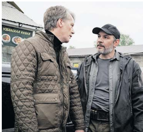
Кадр из фильма «Леший»

Помогая местной полиции, он раскрывает загадочные дела, след которых теряется в лесу, и пытается разобраться с личной драмой. Роль главного героя исполняет известный актер театра и кино Евгений Терских. Производством занимается режиссер Александр Колесник — создатель ярких драм и триллеров. В 2026 году сериал выйдет на телеканале НТВ.