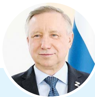
Александр Беглов, губернатор Петербурга:

«Вручение знака «Жителю блокадного Ленинграда» — всегда особенное событие. Для каждого блокадника это самая ценная награда. Долгие годы формальная граница — четыре месяца пребывания в осажденном городе — разделяла людей, судьба которых навсегда связана с блокадным Ленинградом. Мы много раз говорили, что каждый день, прожитый в блокадном городе, был подвигом, и нельзя измерять степень страдания днями. Это справедливо для взрослых, а еще больше для детей, которые жили в Ленинграде или родились в годы блокады».