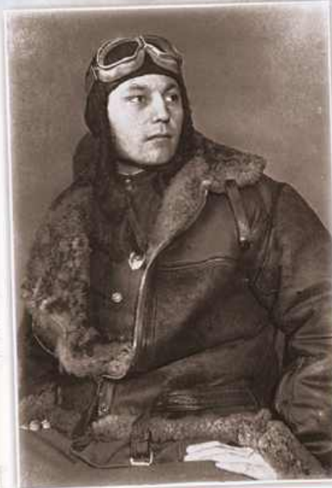
Александр Иванович Покрышкин летчик-истребитель, первый Трижды Герой Советского Союза, председатель ДОСААФ с 1972 по 1981 годы