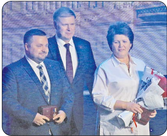
На площадке спортивного комплекса «Юбилейный» состоялось праздничное мероприятие в честь Дня местного самоуправления, на котором наградили лучших представителей муниципалитетов Санкт-Петербурга.

За большой личный вклад в развитие системы местного самоуправления Санкт-Петербурга