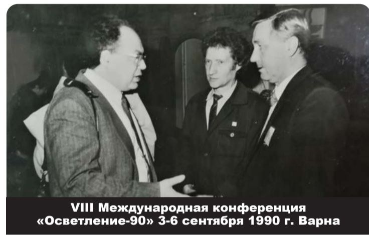
VIII Международная конференция «Осветление-90» 3-6 сентября 1990 г. Варна

Ветеранская организация играет огромную роль не только в патриотическом воспитании молодежи. Немаловажную роль играет работа наставническая, люди, прошедшие большую жизненную школу, должны поделиться своим опытом. И если хоть несколько