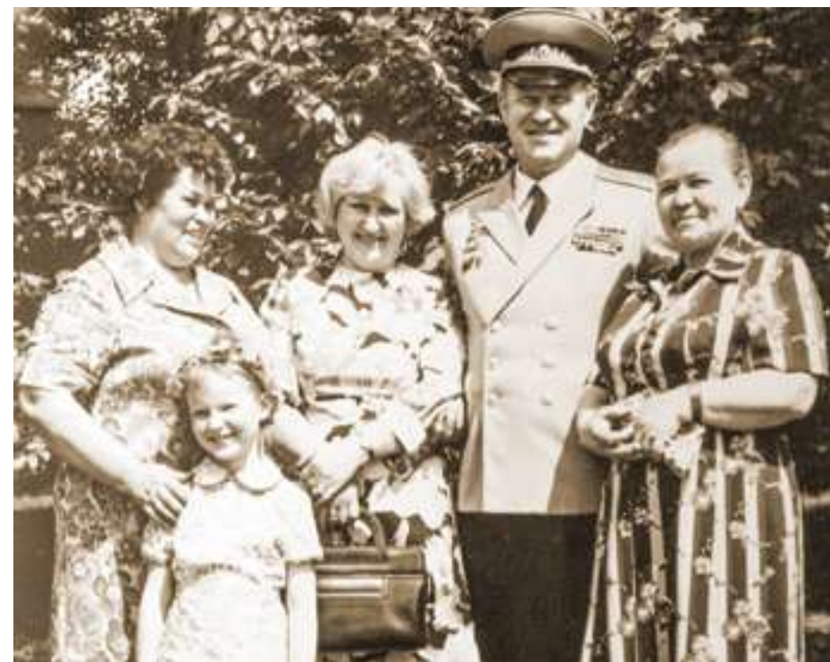
Встреча однополчан в г.Харькове. 9 мая 1977 г.