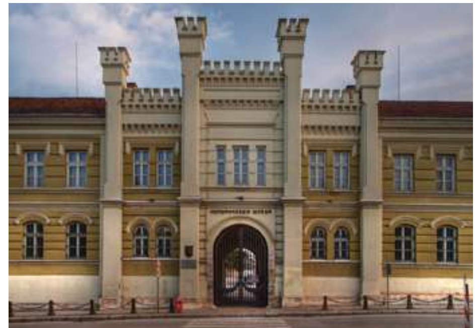
Главный вход в региональный исторический музей города Плевен