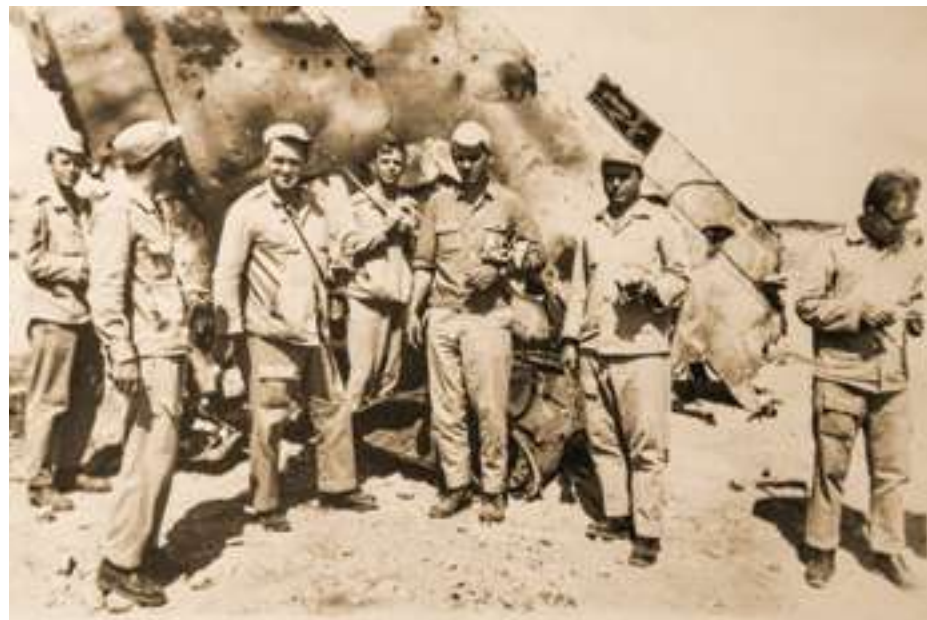
Каир. 1970-1971 гг.