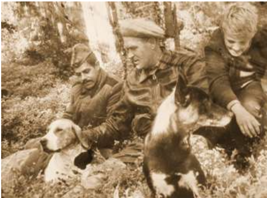
На охоте. Архангельск. 1976 г.