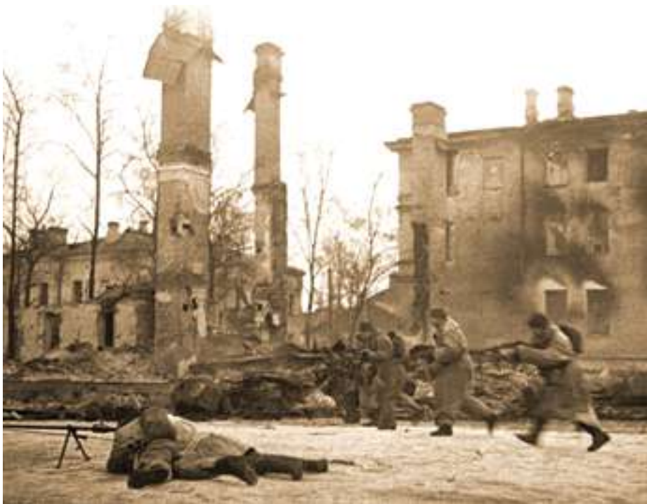
Советские военные в уличном бою за освобождение Гатчины

Наши успешные действия в боях против немецко-фашистской авиации в 1944 году были отмечены правительственными наградами. Орденами и медалями были награждены: командир дивизиона, командиры батарей, отличившиеся бойцы личного состава. Мне был вручён орден Красной Звезды, мой первый боевой орден».