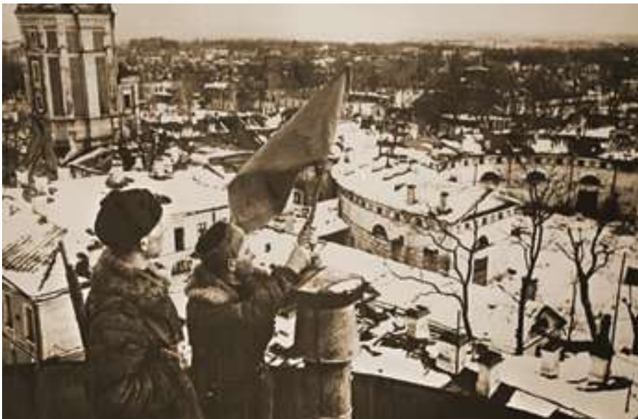
Советские военнослужащие устанавливают красный флаг на арке Лицея в освобождённом Пушкине

И вот наступил долгожданный день нашей Ленинградской Победы! 27 января 1944 года в День полного освобождения Ленинграда от фашистской блокады мы вместе со всеми ликовали и не сдерживали слёз радости.