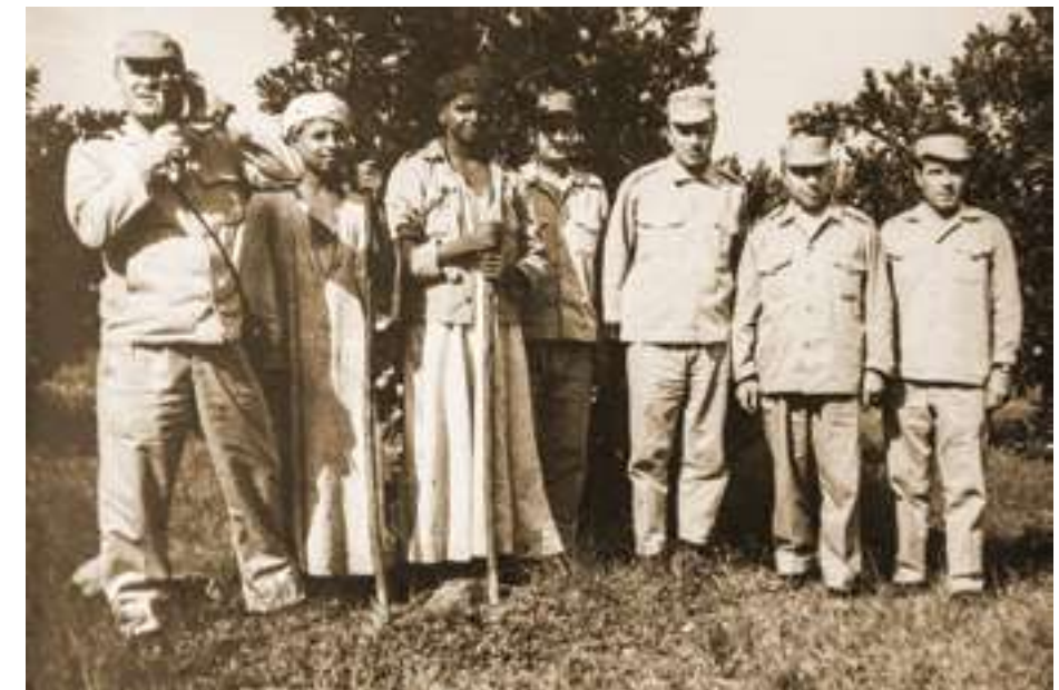
С местными жителями. Каир. 1970-1971 гг.