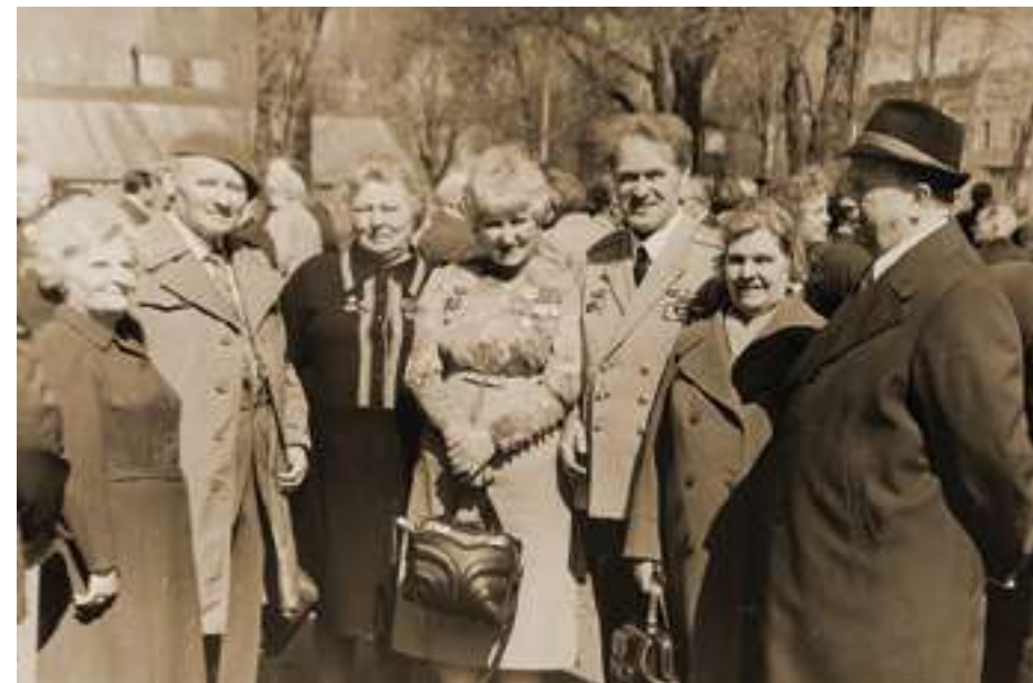
Встреча однополчан. 9 мая 1969 г.

Награждён шестью боевыми наградами, в том числе, за образцовое исполнение заданий командования в послевоенный период, двумя орденами Красного Знамени и орденом Трудового Красного Знамени, а также шестнадцатью Почётными грамотами.