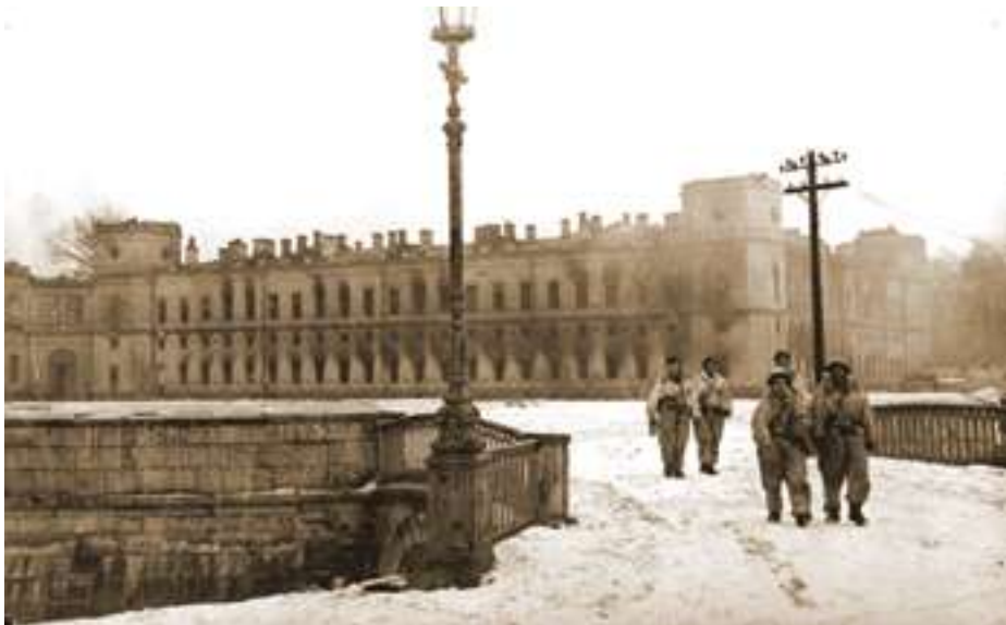
Гатчинский дворец. 26 января 1944 г.

Уже на следующий день мы приступили к тренировочным стрельбам. Они показали хороший результат. Получалось, что при своевременном обнаружении противника каждая батарея может сделать в первые же 10-20 секунд от двух до четырёх залпов, а это означало, что все вместе мы сможем сделать от 32 до 96 залпов, что существенно увеличивало эффективность огня. В этом и была сила нашего замысла. Ещё одним условием достижения