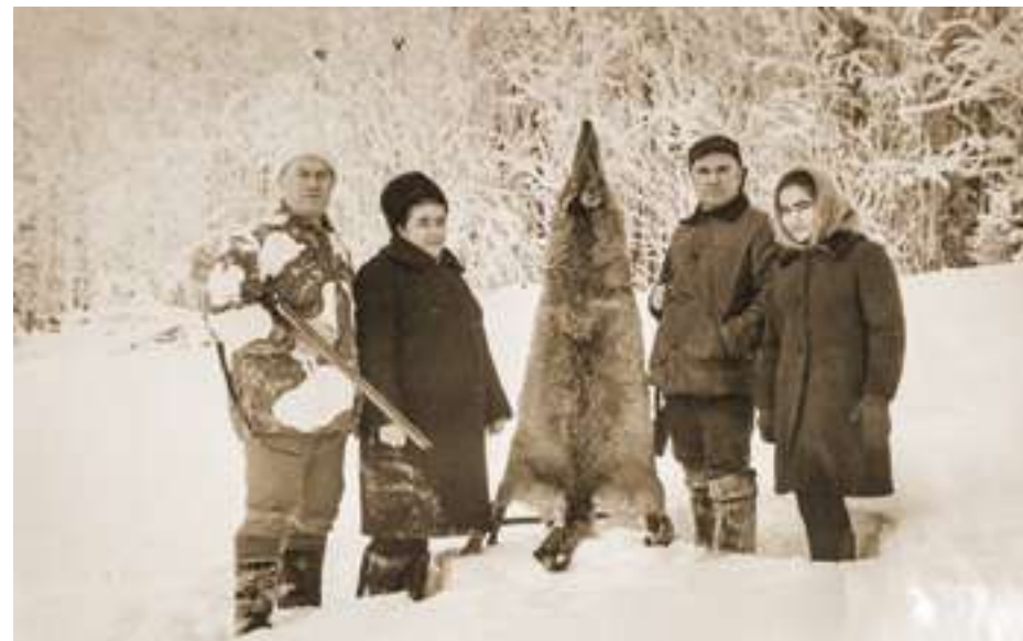
На охоте. 1960-е гг.