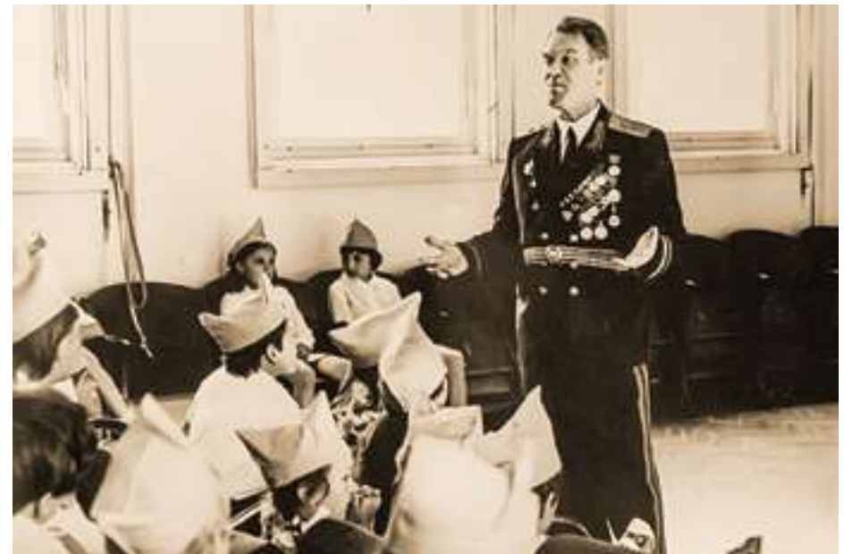
В Чехословакии. 1977-1982 гг.