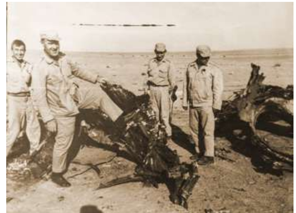
Со сбитым израильским самолетом «Фантом». Каир. 1970-1971 гг.