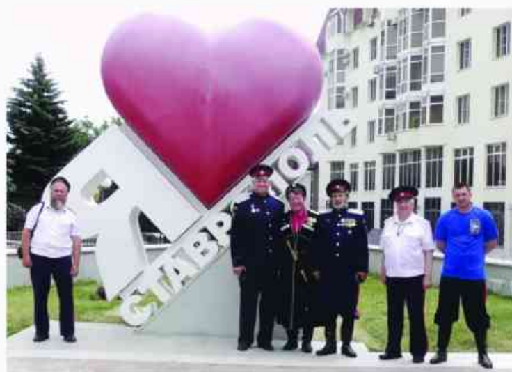
В столицу Ставропольского казачьего войска невозможно не влюбиться