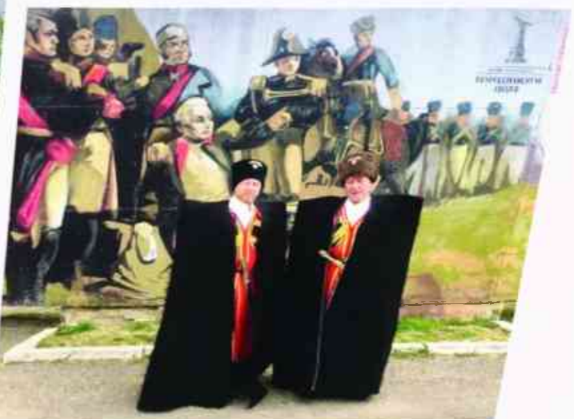
Хорошие контакты установились между казаками Конвоя и Государственным историческим музеем-заповедником «Бородинское поле». Казаки принимали активное участие во многих мероприятиях музея