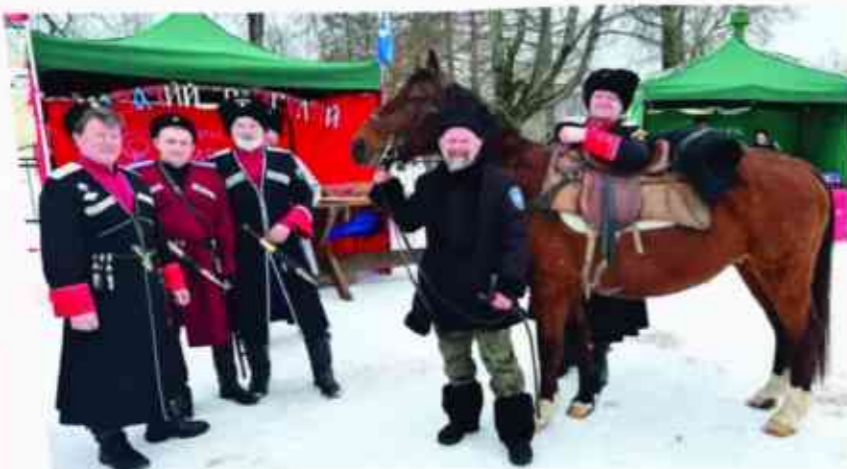
«Казачий разгуляй» на Масленицу в Бородино