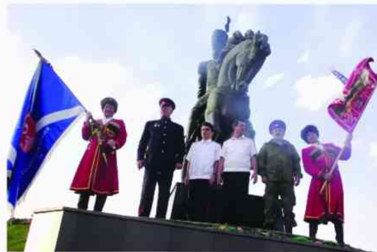
У памятника атаману Матвею Платову на Ставропольской земле