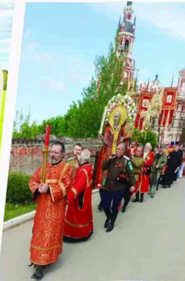
22 мая 2023 года. День города Можайска. В крестном ходе - казаки Годуновского отдела Конвоя