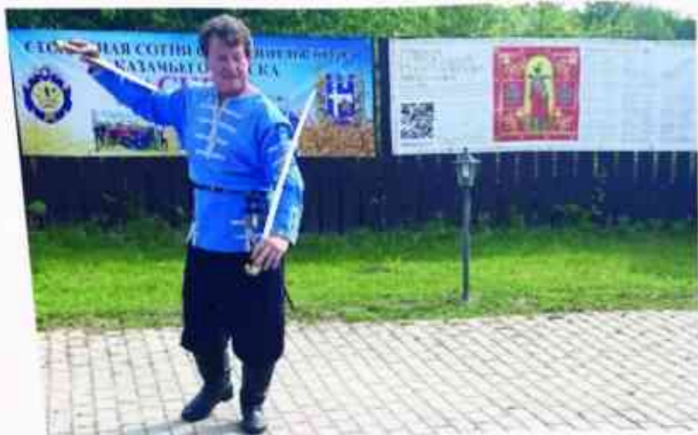
Наши казаки принимают участие во многих соревнованиях по фланкировке (владению шашкой), а также в показательных выступлениях