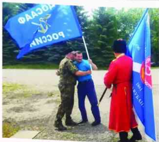
Встреча в Эссентуках