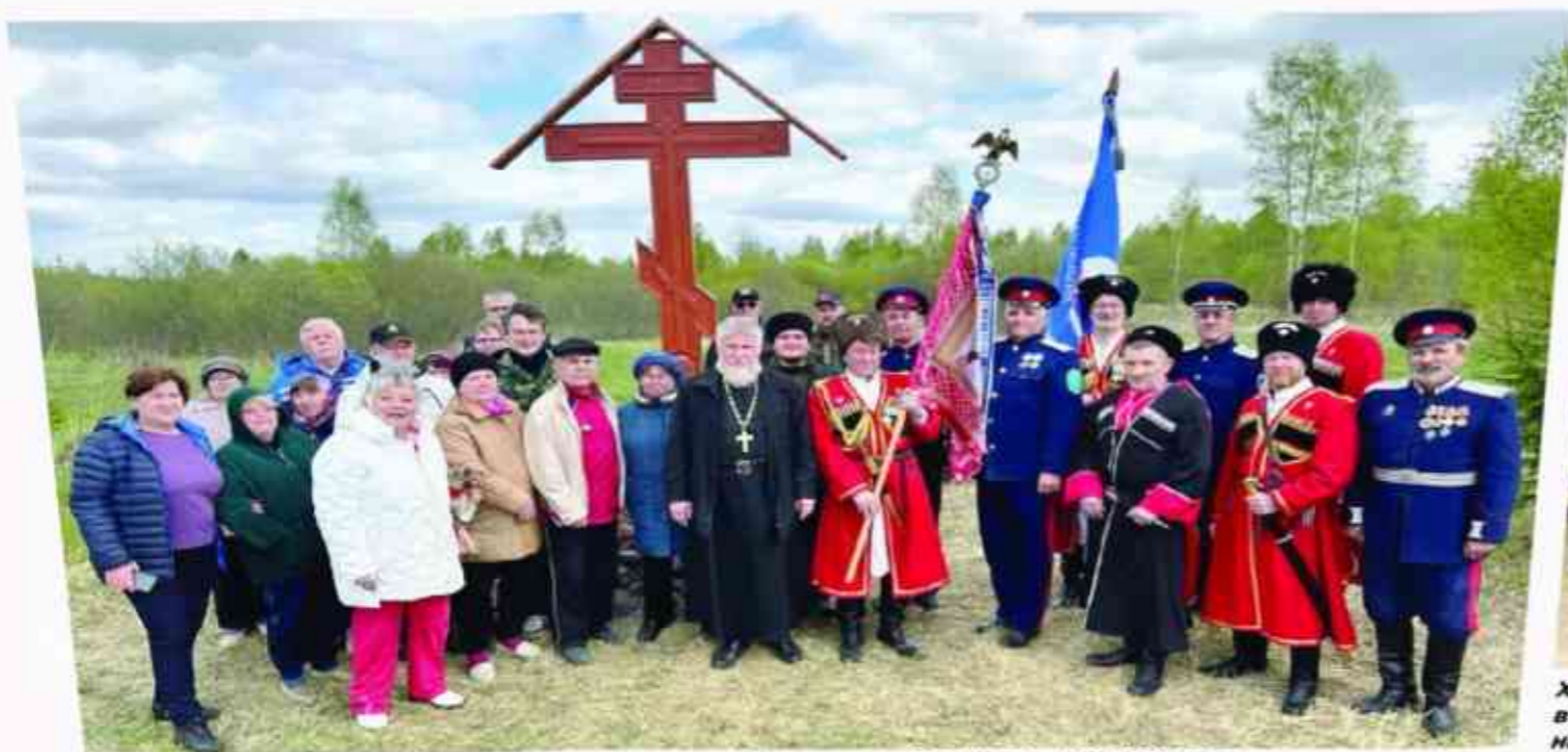
Установка поклонного креста в деревне Годуново. Май 2023 года