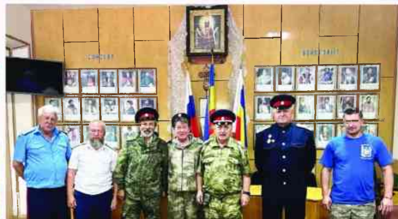
У казаков Каменск-Шахтинска