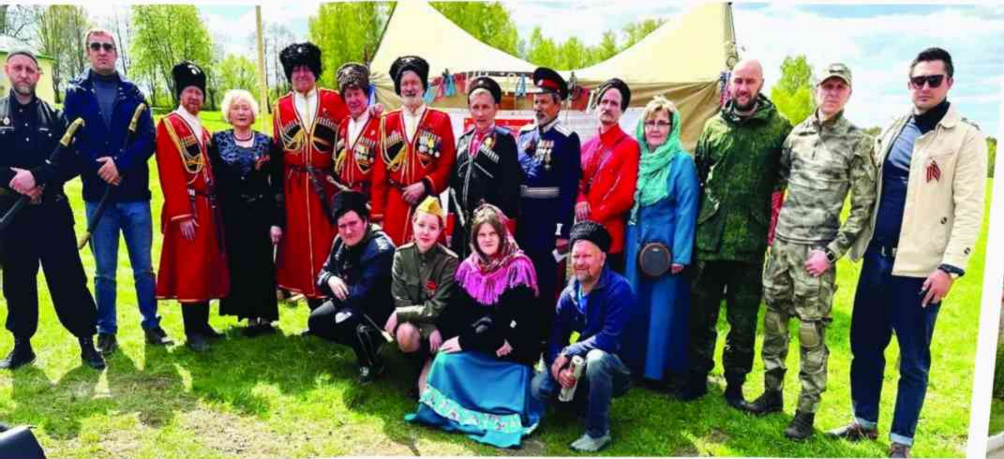
9 мая 2023 года казаки Годуновского отдела Конвоя приняли участие в праздничных мероприятиях на Бородинском поле