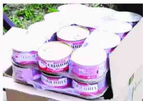
С собой в дорогу казаки взяли гуманитарную помощь для казачьей бригады «Дон»