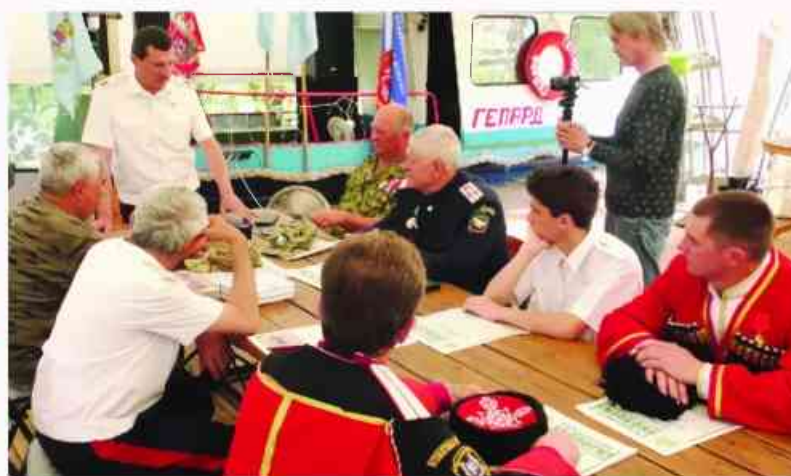
В Воронежской области наши казаки были тепло встречены казаками Северо-Донского Казачьего округа Донского казачьего войска СКР