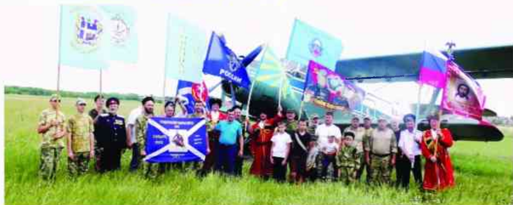
На аэродроме ДОСААФ Ставропольского казачьего войска