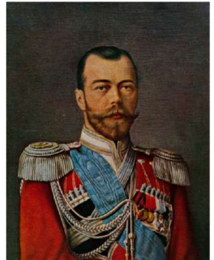
ЕГО ИМПЕРАТОРСКОЕ ВЕЛИЧЕСТВО ГОСУДАРЬ ИМПЕРАТОРЪ НИКОЛАЙ II АЛЕКСАНДРОВИЧЪ Державный Шефъ Л.-Гв. 1, 2-й Кубанскихъ и Л.-Гв. 3 и 4-й Терскихъ казачьихъ сотенъ Собственнаго ЕГО ИМПЕРАТОРСКОГО ВЕЛИЧЕСТВА Конвоя Изволилъ числиться въ Собственномъ Конвоѣ съ 6 мая 1868 года. Мученически убитый въ ночь съ 16 на 17 Іюля 1918 года въ Екатеринбургѣ.

Въ Конвоѣ не было случаевъ откомандированія обратно въ свой полкъ прикомандированнаго на испытаніе офицера. Одинъ изъ прикомандированныхъ совершилъ слѣдующихъ проступокъ. На Страстной недѣлѣ Государь Императоръ говѣлъ въ Пещерномъ храмѣ Государева Фе-