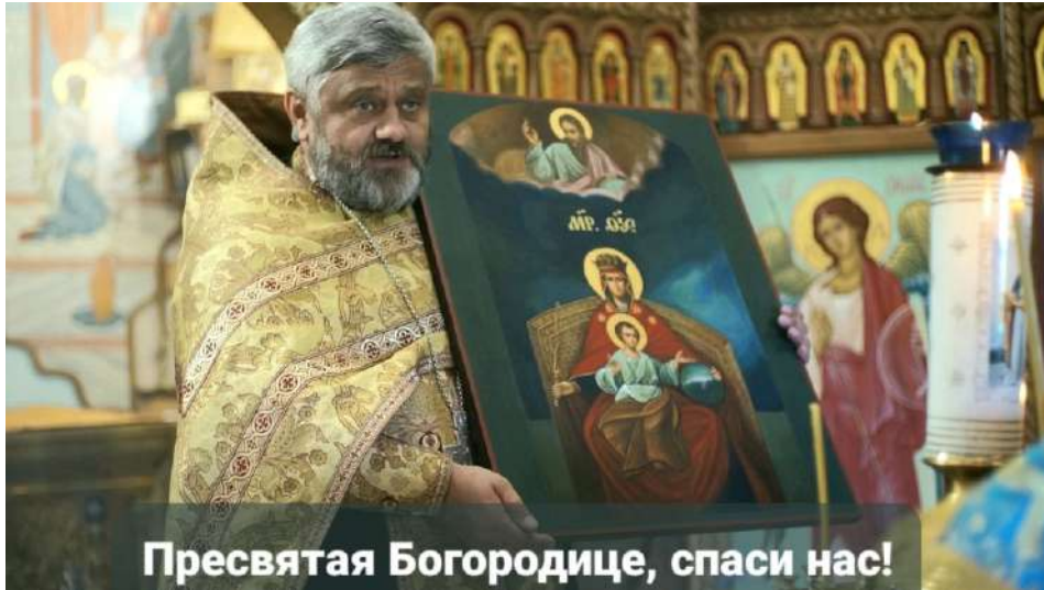
Пресвятая Богородице, спаси нас!

Д ержавная икона Богородицы сегодня. Тихий образ о том, Кто подлинный правитель России.