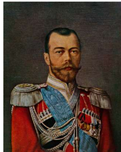
ЕГО ИМПЕРАТОРСКОЕ ВЕЛИЧЕСТВО ГОСУДАРЬ ИМПЕРАТОРЪ НИКОЛАЙ II АЛЕКСАНДРОВИЧЪ Державный Шефъ Л.-Гв. 1, 2-й Кубанскихъ и Л.-Гв. 3 и 4-й Терскихъ казачьихъ сотенъ Собственнаго ЕГО ИМПЕРАТОРСКАГО ВЕЛИЧЕСТВА Конвой Изволилъ числиться въ Собственномъ Конвоѣ съ 6 мая 1868 года. Мученически убитъ въ ночь съ 16 на 17 Июля 1918 года въ Екатеринбургѣ.

Но пока сердце, безгранично преданное родной Части, еще бьется, считаю своимъ священнымъ долгомъ всѣ касающіеся нашей исторіи документы, бережно хранимые г. г. офицерами Конвоя ЕГО ВЕЛИЧЕСТВА, въ видѣ «Краткаго Очерка», передать тѣмъ, кто послѣ нашей смерти будетъ имѣть честь служить подъ нашими Славою увѣнчанными Штандартами.