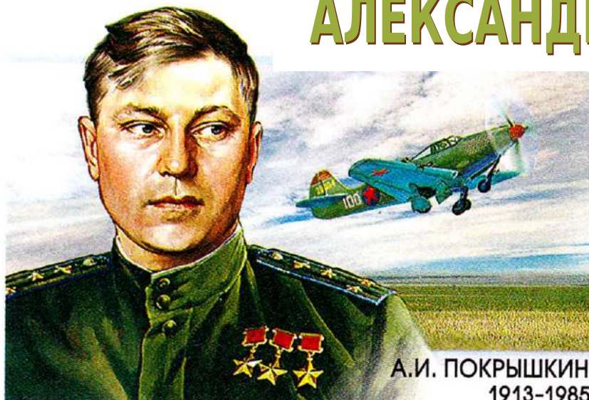
А.И. ПОКРЫШКИН 1913-1985