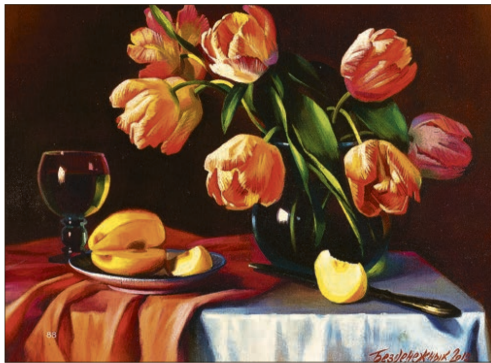
Открытие выставки состоялось 2 марта, она будет работать до 20 марта 2023 года. Часы работы выставочного зала: ежедневно с 12.00 до 19.00, среда — выходной. Адрес: г. Сестрорецк, пл. Свободы, д. 1