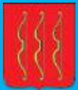
город Великие Луки