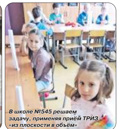
В школе №545 решаем задачу, применяя приём ТРИЗ «из плоскости в объём»