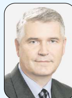
Фото: Александр Фёдоров