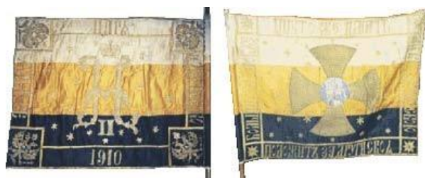
Это знамя принадлежало полку Цесаревича

В любом случае, разве можно хотя бы предположить, что Цесаревич Алексей мог нарушить законы Российской Империи и перевернуть флаг по своей прихоти? Мог ли Государь, законодатель Империи, позволить своему сыну нарушить законодательство государства, которым ему впоследствии предстояло править? Нет, конечно же. Государь Николай II был первым законодателем государства и первым же неукоснительным исполнителем своих законов. Он был для своих верноподданных примером во всём.