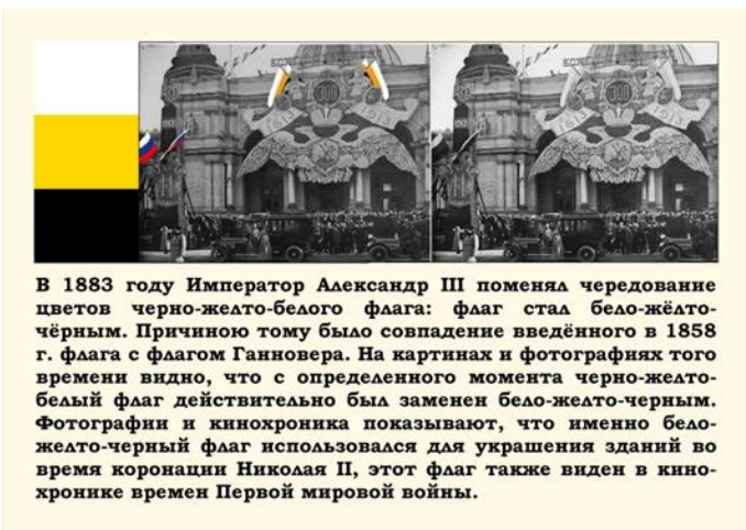
В 1883 году Император Александр III поменял чередование цветов черно-желто-белого флага: флаг стал бело-жёлто-чёрным. Причиной тому было совпадение введённого в 1858 г. флага с флагом Ганновера. На картинах и фотографиях того времени видно, что с определенного момента черно-желто-белый флаг действительно был заменен бело-желто-черным. Фотографии и кинохроника показывают, что именно бело-желто-черный флаг использовался для украшения зданий во время коронации Николая II, этот флаг также виден в кинохронике времен Первой мировой войны.

Дорогие братья и сестры! Для нас на данном этапе вопрос исчерпан. Мы в очередной раз обращаемся с просьбой к нашим братьям-казакам, монархистам и всем нашим оппонентам: не вносить разделений, не оскорблять и не хулить тех, кто имеет по данному вопросу другую точку зрения. В свою очередь, мы всегда готовы обсудить исторические материалы, юридические и законодательные документы по использованию государственной символики в казачьих организациях.