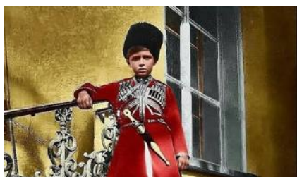
Святой Цесаревич Алексей

Несомненно и то, что при выборе главного символа и атрибута своего военного подразделения, Цесаревич держал совет с отцом, т.к. они были неразрывно связаны друг с другом во всех вопросах. И святой наш Государь Николай II поддержал своего сына в выборе знамени, а возможно и сам посоветовал выбрать такой флаг.