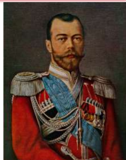
ЕГО ИМПЕРАТОРСКОЕ ВЕЛИЧЕСТВО ГОСУДАРЬ ИМПЕРАТОРЪ НИКОЛАЙ II АЛЕКСАНДРОВИЧЪ Державный Шефъ Л.-Гв. 1, 2-й Кубанскихъ и Л.-Гв. 3 и 4-й Терскихъ казачьихъ сотенъ Собственнаго ЕГО ИМПЕРАТОРСКАГО ВЕЛИЧЕСТВА Конвоя Изволилъ числиться въ Собственномъ Конвоѣ съ 6 мая 1868 года. Мученически убитый въ ночь съ 16 на 17 Юля 1918 года въ Екатеринбургѣ.

Но пока сердце, безгранично преданное родной Части, еще бьется, считаю своимъ священнымъ долгомъ всё касающіеся нашей исторіи документы, бережно хранимые г. г. офицерами Конвоя ЕГО ВЕЛИЧЕСТВА, въ видѣ «Краткаго Очерка», передать тѣмъ, кто послѣ нашей смерти будетъ имѣть честь служить подъ нашими Славою увѣнчанными Штандартами.