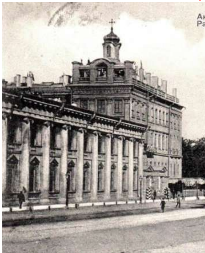
С. Петербургъ - St-Petersbourg Аничковъ дворецъ и Невскій просп. Palais Anitschkoff et Perspective de Nevsky.