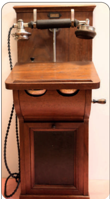
Аппарат телефонный настенный Telegrafverket конец XIX века. Коллекция Музейного комплекса в Разливе

тире Начальника завода. Но также: в трёх домах, занимаемых начальниками мастерских, в квартире Правителя канцелярии и по телефону в лаборатории, офицерском собрании, и местном лазарете.