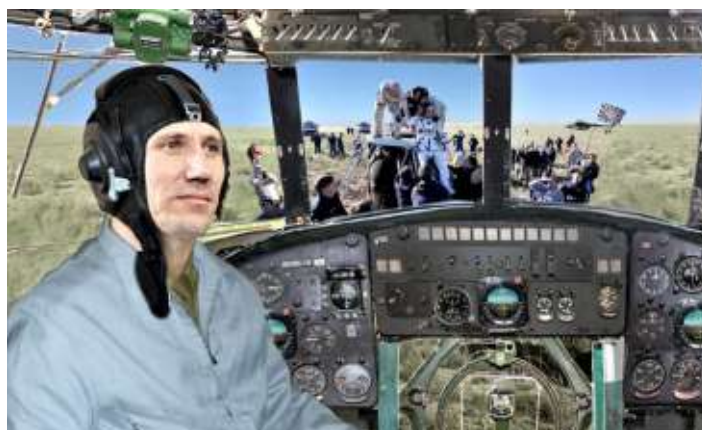
В память о службе в легендарном 280-м Отдельном вертолётном полку ТуркВО.