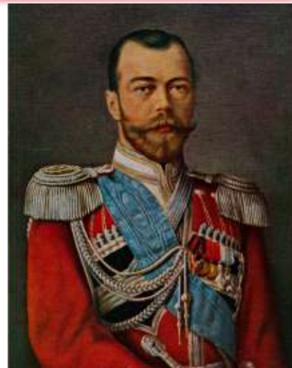
ЕГО ИМПЕРАТОРСКОЕ ВЕЛИЧЕСТВО ГОСУДАРЬ ИМПЕРАТОРЪ НИКОЛАЙ II АЛЕКСАНДРОВИЧЪ Державный Шефъ Л.-Гв. 1, 2-й Кубанскихъ и Л.-Гв. 3 и 4-й Терскихъ казачьихъ сотенъ Собственнаго ЕГО ИМПЕРАТОРСКОГО ВЕЛИЧЕСТВА Конвоя Изволилъ числиться въ Собственномъ Конвоѣ съ 6 мая 1868 года. Мученически убитый въ ночь съ 16 на 17 Іюля 1918 года въ Екатеринбургѣ.

17-го сентября Царская Семья прибыла въ Петербургъ, украшенный русскими и датскими національными флагами. Отъ Царскосельскаго желѣзнодорожнаго вокзала стояли войска по Загородному проспекту г Владимірской, Невскому, Большой Морской до Зимняго Дворца.