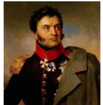
Николай Николаевич Раевский-старший

Большую часть службы провел на Кавказе. В 1826-м (в свои 25) он уже имел звание полковника и командовал Нижегородским драгунским полком в Грузии. В 1829-м его произвели в должность начальника Черноморской прибрежной линии.