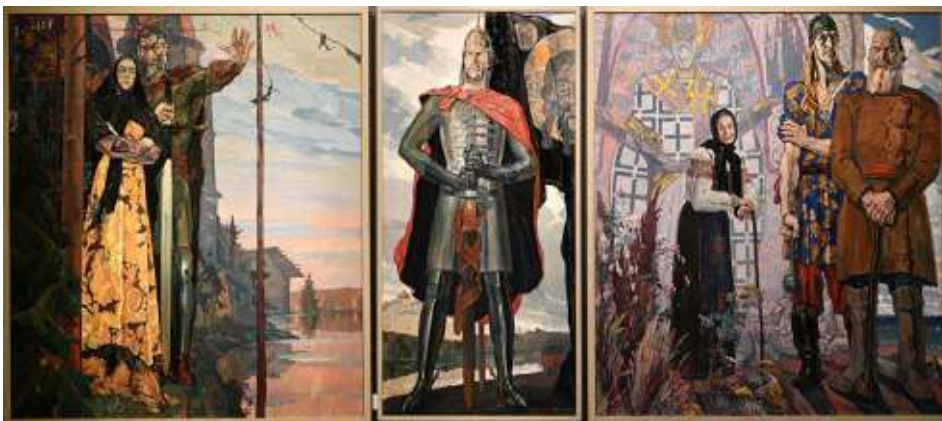
П. Корин создал этот триптих в тяжелые годы Великой Отечественной Войны

Сегодня, в эпоху развития сетевых медиа и навязывания странами Запада ценностных установок общества потребления и либертарианского социального эгоизма, как никогда актуальны обращение к этическому наследию исконных духовных ценностей российского общества, сохранение исторического и культурного наследия предков, ценностей самоотверженного патриотического служения общему благу и родной стране.