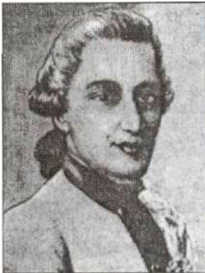
А. Н. Сенявин

По высочайшему Ея И.В. указу поведенные 2 фрегата в Новохоперской верфи по верхней их сверх нижней палубы набор построены и с тем первый 12-го, а второй 13 апреля на воду спущены, которые и от новохоперской верфи отправились рекою вниз, первый сего месяца 1-го, а второй 2-го числа (...)