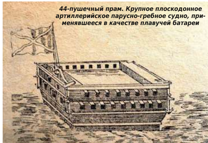
44-пушечный прам. Крупное плоскодонное артиллерийское парусно-гребное судно, применявшееся в качестве плавучей батареи

Надо сказать, что Ласси был личностью весьма неординарной. Ирландец по национальности, он ещё в юном возрасте принял участие в Войне двух королей в Ирландии, эмигрировал во Францию, вступил в Ирландский отряд, участвовал в ряде кампаний в Европе. Ласси в 1700 году поступил на русскую службу, участвовал в Северной войне, Прутском и Персидском походах. В 1727 г. он выполнил весьма деликатное поручение Меньшикова, выдворив из Курляндии претендовавшего на герцогский престол Морица Саксонского. В 1733 году он был послан командиром корпуса, отправленного в Речь Посполитую для поддержки Августа III против Станислава Лещинского. Свою миссию он выполнил успешно. Войска под командованием Ласси начали осаду Данцига. В 1735 г. Ласси командовал армией, направленной русским правительством на помощь австрийцам. Рейнский поход завершился успешно. Появление русских войск в Германии заставило врагов Австрии склониться к миру. Многие современники сравнивали Ласси с Минихом и выводы чаще всего были не в пользу последнего. По их мнению, Ласси не уступал Миниху в военном умении, и выигрывал тем, что был равнодушен придворным интригам.