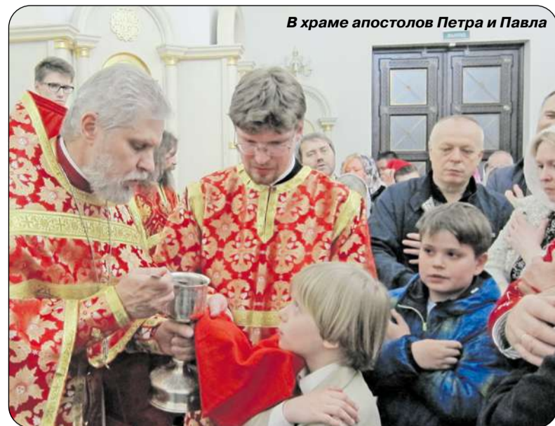
В храме апостолов Петра и Павла

С тех пор он и благоукрашается, изменился внешне и внутренне, обрёл почитаемые святыни, иконы. За всем этим стоит многотрудная каждодневная работа привлечения людей, что своими знаниями, средствами, поддержкой делают возможным жить и существовать храму. И здесь внимание, любовь настоятеля, заинтересованность в каждом конкретном человеке делали и делают своё дело. Мудрое, глубокое пастырское слово батюшки, его наставления привели за эти годы многих людей в Церковь, к истинной вере, к пониманию великой мудрости – «Без Бога – ни до порога», со-