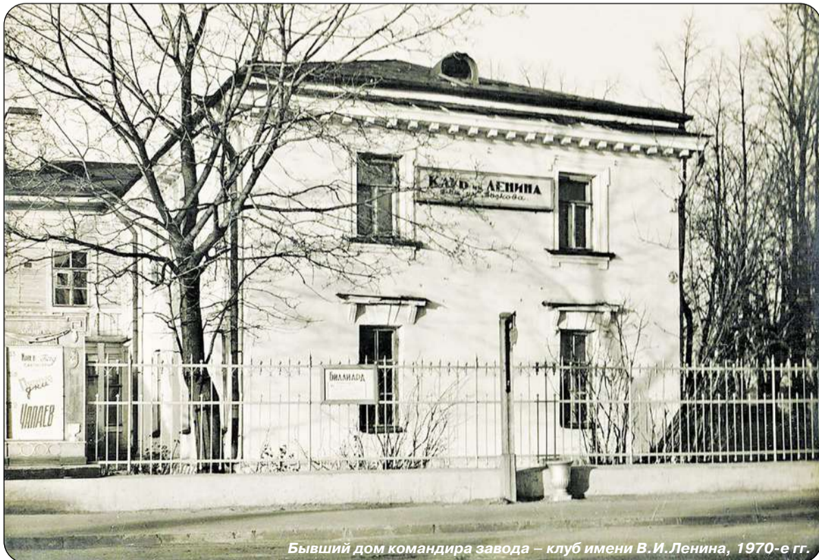
Бывший дом командира завода – клуб имени В.И.Ленина, 1970-е гг.