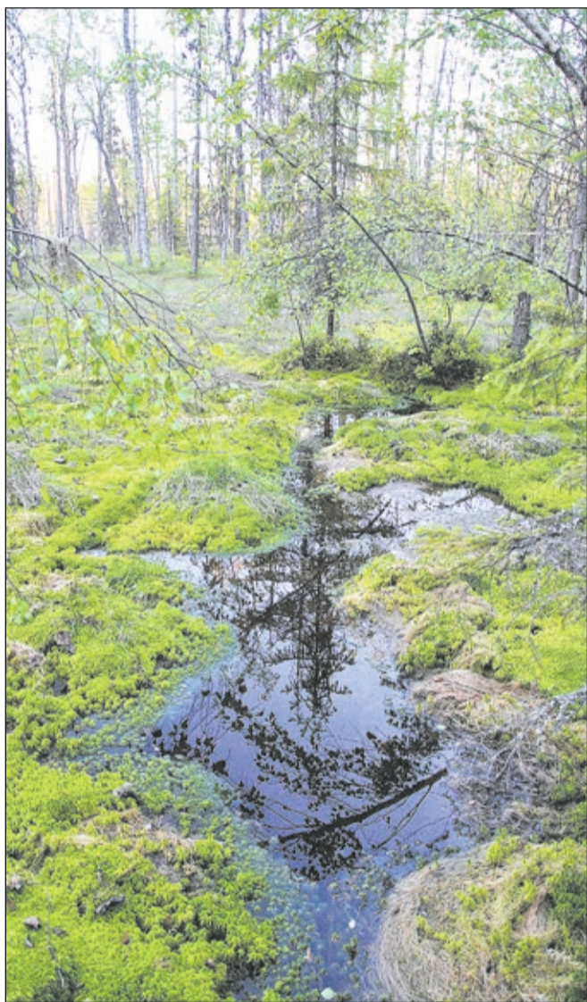
Таким болотным ручейком начинается река Сестра