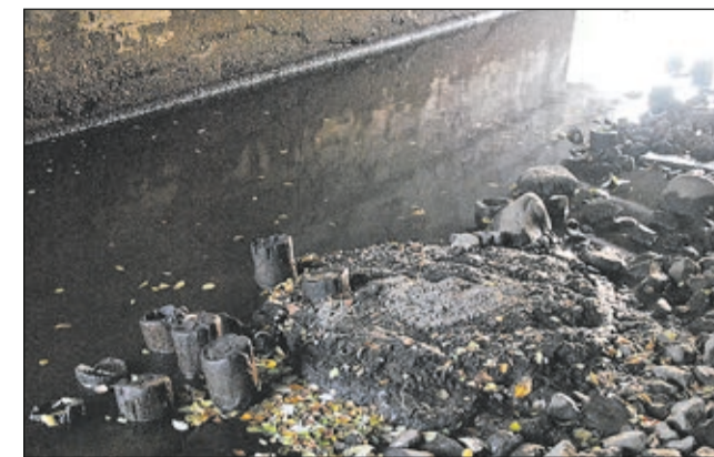
Остатки деревянных свай прежнего моста

Историческое фотоизображение деревянного моста на месте современного Литейного моста по оси улицы Токарева (бывших Литейной и Рыбацкой улиц) нашлось в домашнем архиве бывшего жителя Сестрорецка Валентина Павловича Соколова. Фото датировано 1949 годом. Причем, деревянный мост на фотографии виден целиком.