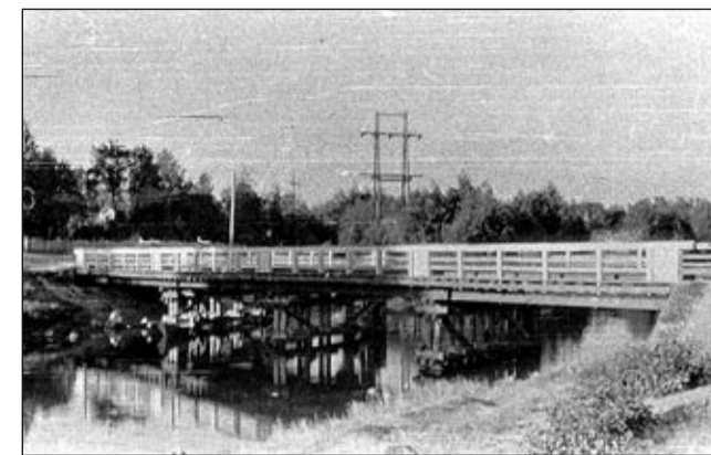
1949 г.