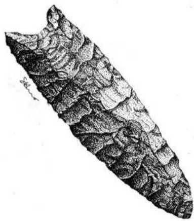
Наконечник для копья периода Кловис рис. Сюзанны Вдовенко

месяц, но никогда не дольше. В тот довольно отдалённый период американской истории они, в общем, следовали за движущимися стадами диких животных. Это были времена мегафауны - мастодонтов, мамонтов, гигантских ленивцев (в Южной Америке), гигантских бизонов, больших хищников. Охотились они и за мелкой дичью - черепахами, бобрами, зайцами; также они ловили рыбу. Но главной пищей для них было мясо крупных животных. Зимой они строили себе временные жилища. Скорее всего, деревянные брусы служили опорой, а стены и крыша были покрыты шкурами или растительным материалом. Возможно, зимой эти временные обиталища обогривались очагами изнутри, летом костры жглись снаружи. Их кочевые пути диктовались не только движением стад диких животных, но и экономикой каменных орудий. Людям нужно было находить места с наилучшим твёрдым камнем для производства этих орудий. Они встречались в специальных местах с другими группами людей для товарного обмена. Эти группы людей были разросшимися семьями, которые вместе жили и охотились. Встречаясь, группы людей обменивались сырьём, каменными орудиями, вступали в браки, устраивали пиры.