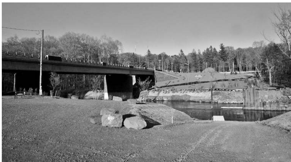
На месте палеоиндейской стоянки Брайана Джонса на берегу реки Фармингтон теперь новый мост и парковка для автомобилей (май 2020).

- Люди эпохи Кловис - это обозначение первого раннего палеоиндейского периода в Северной Америке. Признаком этой эпохи служит особый тип каменного наконечника для копья, впервые найденного в 1935 году возле поселения Кловис в штате Нью-Мексико. На нашем северо-востоке каменных наконечников, один в один похожих на кловис-наконечник, не найдено; у нас найдены похожие, но немножко другие наконечники. Люди Кловис - на самом деле обозначение первых людей Северной и Южной Америки. Люди эпохи Кловис производили орудия, включая наконечники для копий длиной 10-15 см с выгнутым желобком с двух сторон у основания, что, как, мы понимаем, облегчало крепление к древку. Они умели производить длинные каменные лезвия путём послойного обтёсывания сердечников из твёрдого камня - кремня, риолита, яшмы, кварца. Это были удобные ножи для разделки туш животных, обработки плодов и кусков дерева. Кто были эти люди в широком понимании и что они делали? Археология даёт нам одномоментные картинку того, что люди делали в прошлом. Нам нужно принять за должное тот факт, что мы восстанавливаем картину их жизни по оставленному ими мусору. Вещи, по-настоящему необходимые, они забрали с собой. И всё-таки, я думаю, мы имеем неплохое представление об их повседневной жизни. Они были ярко выраженными кочевниками. Они делали стоянки на одну-две ночи, одну-две недели, может даже