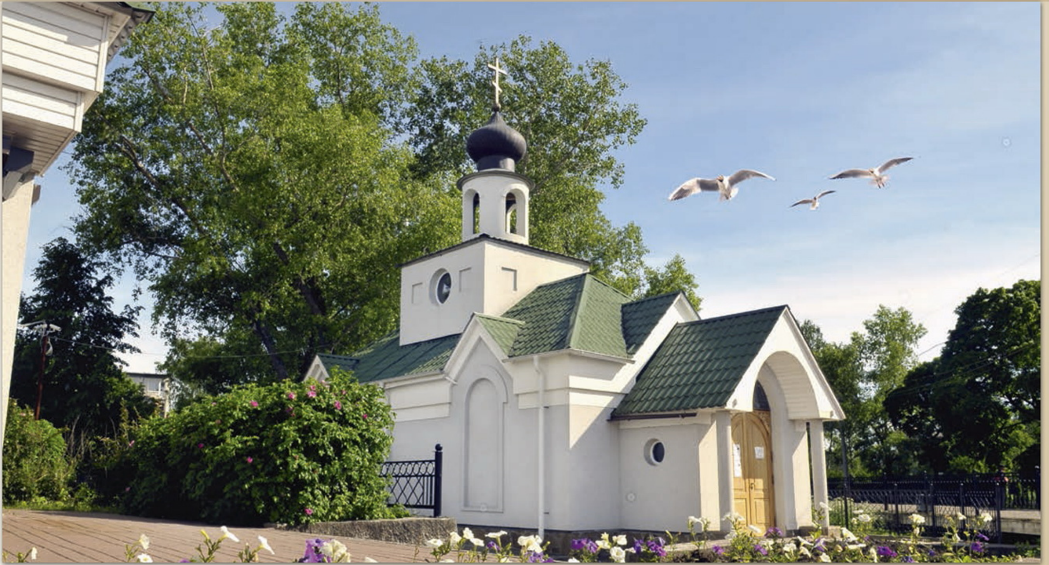
Храм Тихвинской иконы Божией Матери, г. Сестрорецк

Храм был заложен в июле 2004 года, в дни, когда величайшая святыня православия — чудотворная Тихвинская икона Божией Матери — вернулась в Россию.