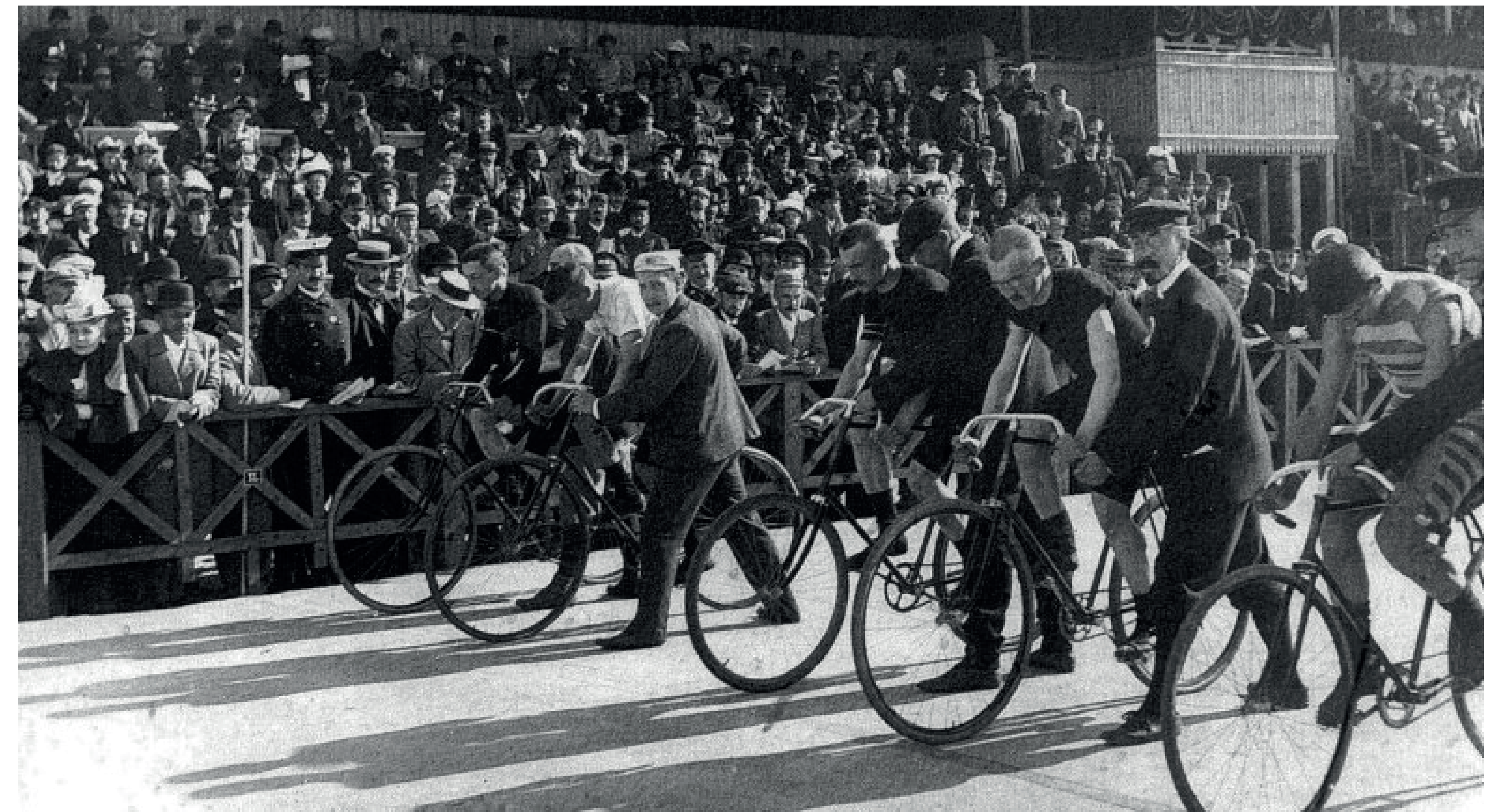
Велодром в Стрельне. Гонщики на старте во время соревнований. Петербург. 1896 год

В 1897 году было создано «Петербургское велосипедно-атлетическое общество».