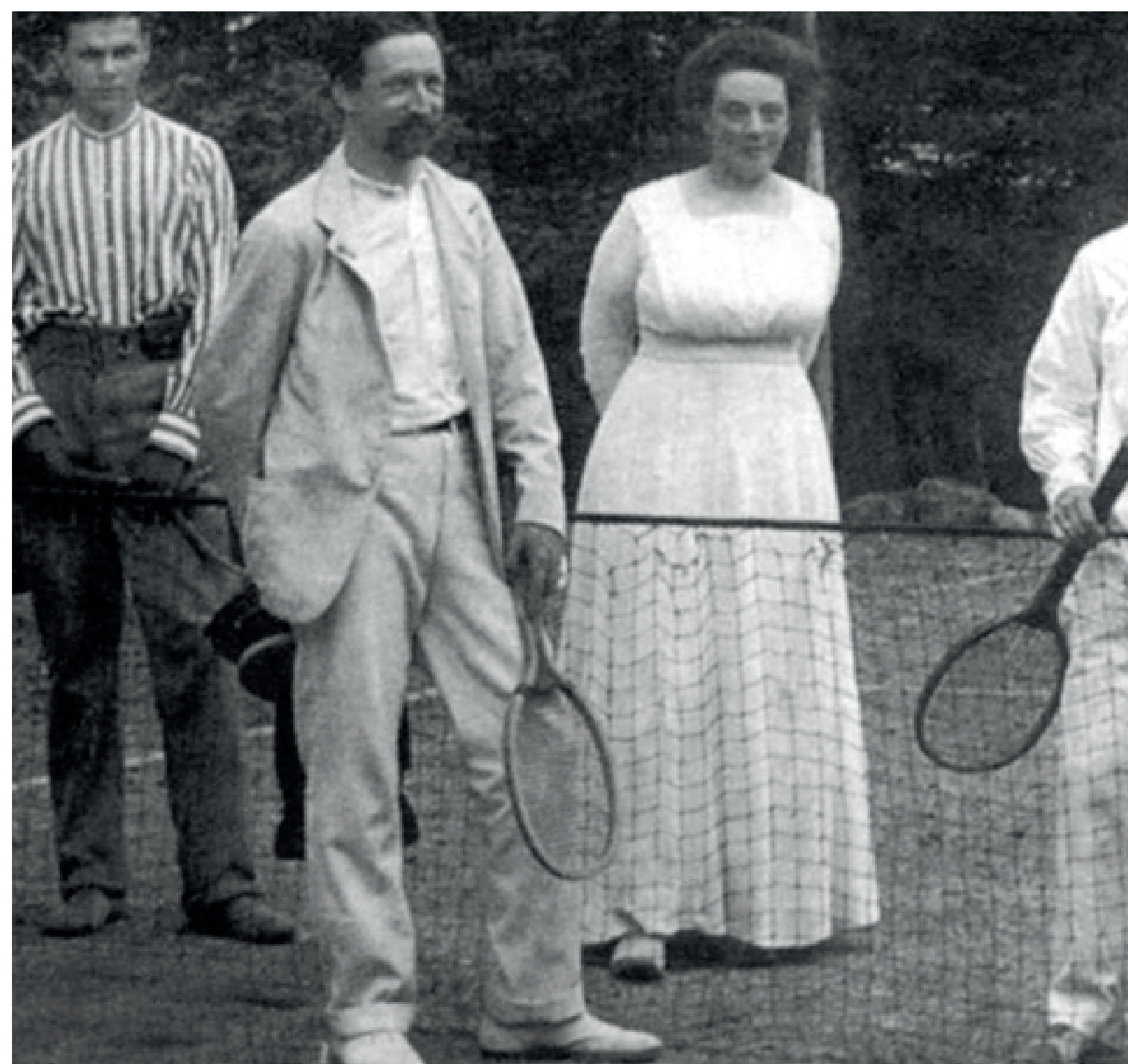
А.П. Чехов на теннисном корте

В 1903 году на кортах Крестовского лаун-теннис клуба прошел 1-й чемпионат Санкт-Петербурга, а в 1907 году – первый Всероссийский теннисный чемпионат.