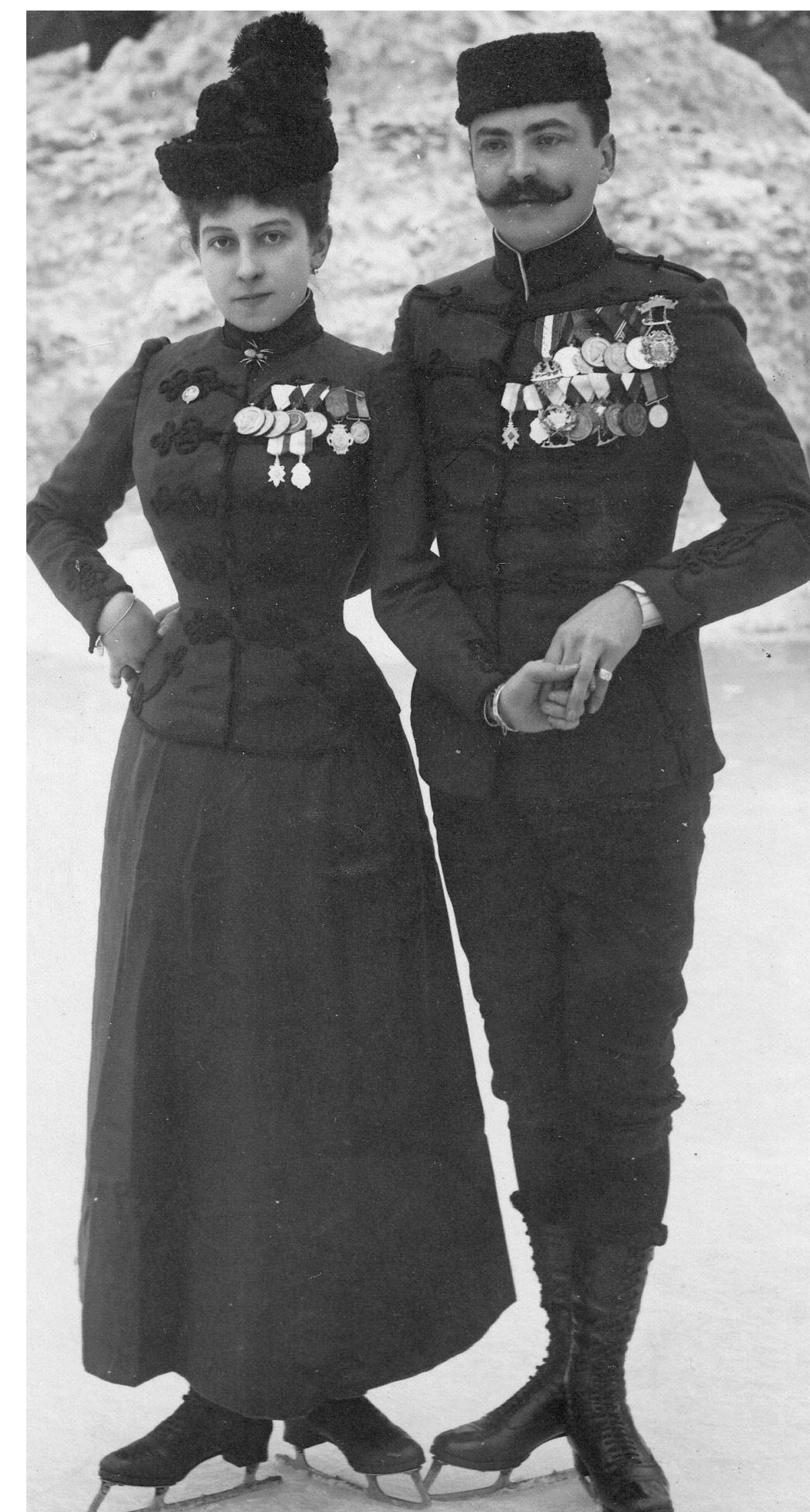
Чемпион Олимпийских игр 1908г. Николай Панин-Коломенкин