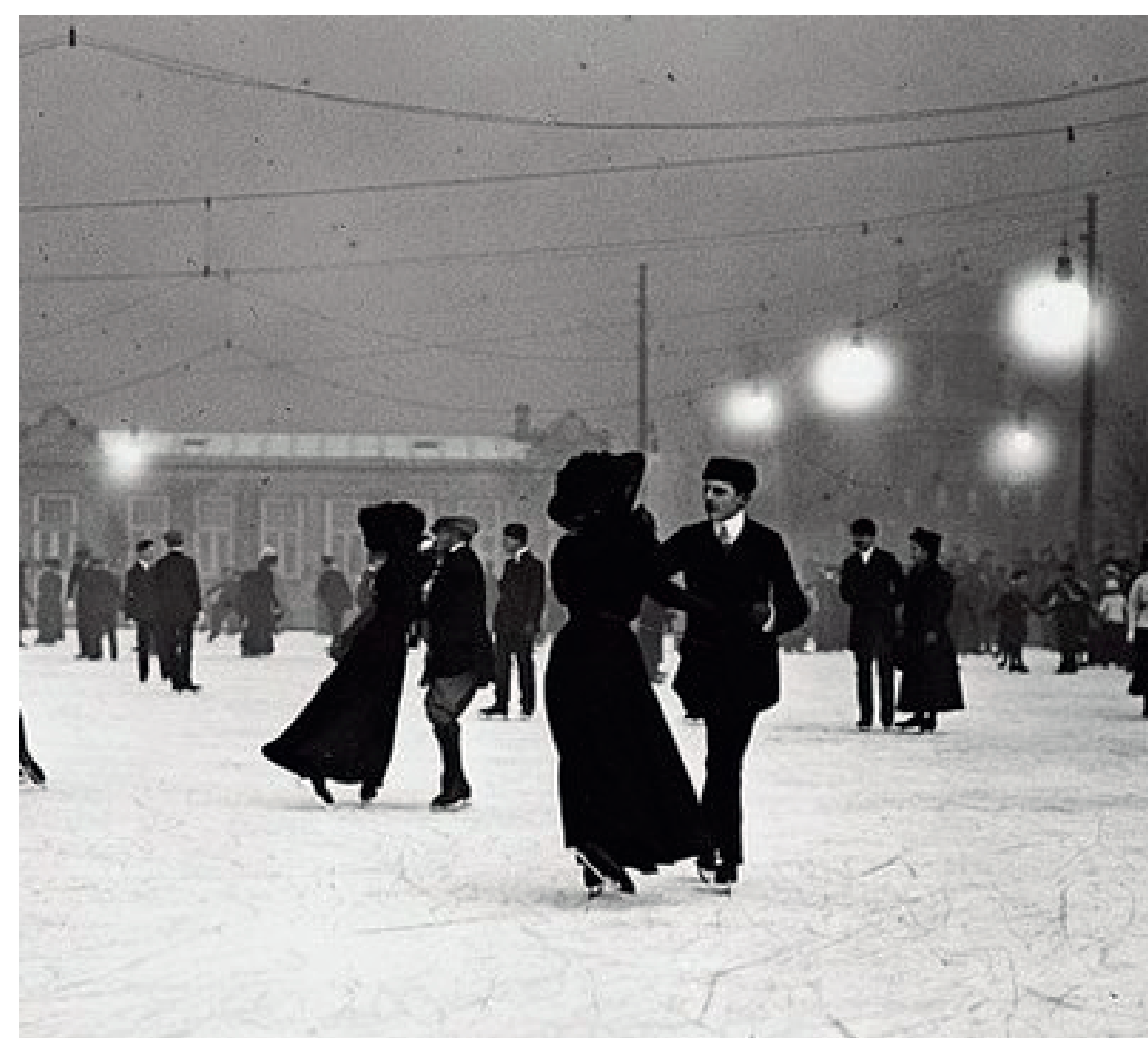
Группы на катке. Петербург. Таврический сад. 1908г.