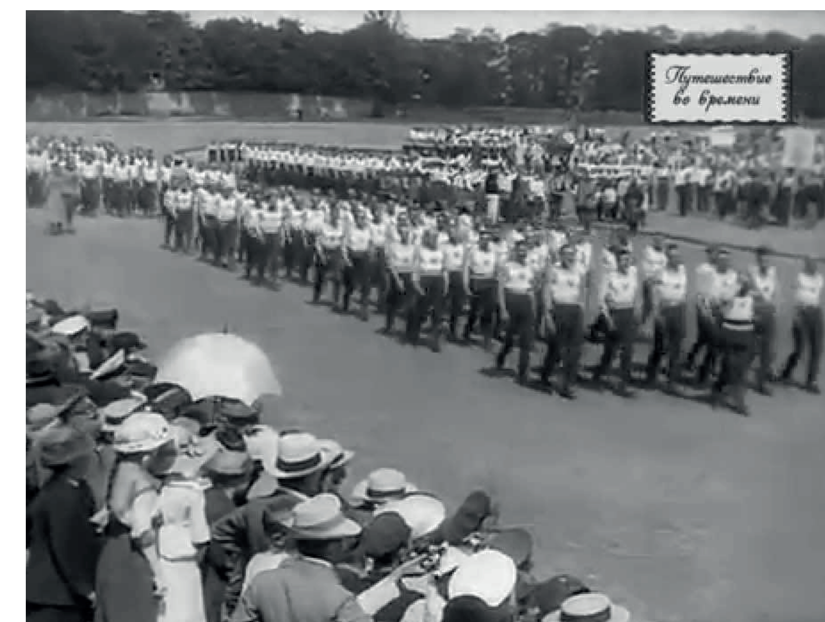
Первая Всероссийская Олимпиада. Киев, август 1913г.