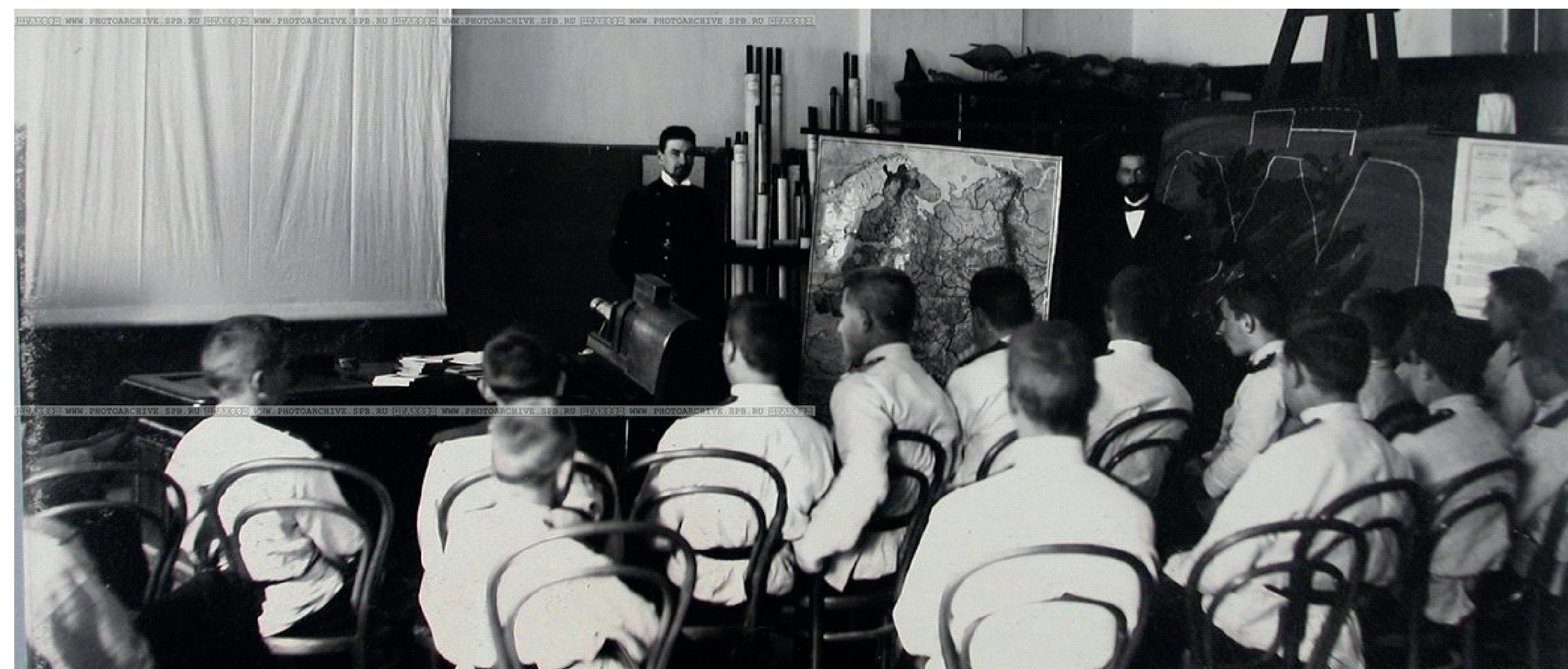
Преподаватель, кадеты и воспитатель в кабинете географии во время урока. На заднем плане проектор. 1901г.

Изучение ремесел, работа в столярной и токарной мастерской были обязательными для образовательных мужских учреждений.