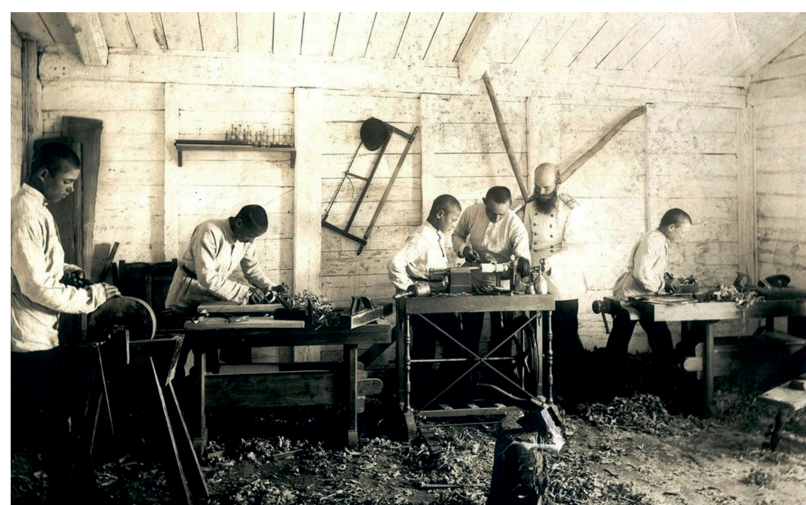
Учащиеся-кадеты на уроке в столярной мастерской

Изучение ремесел, работа в столярной и токарной мастерской были обязательными для образовательных мужских учреждений.