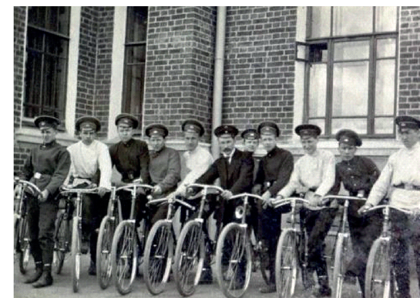
Гимназисты на прогулке. Москва, 1913г.