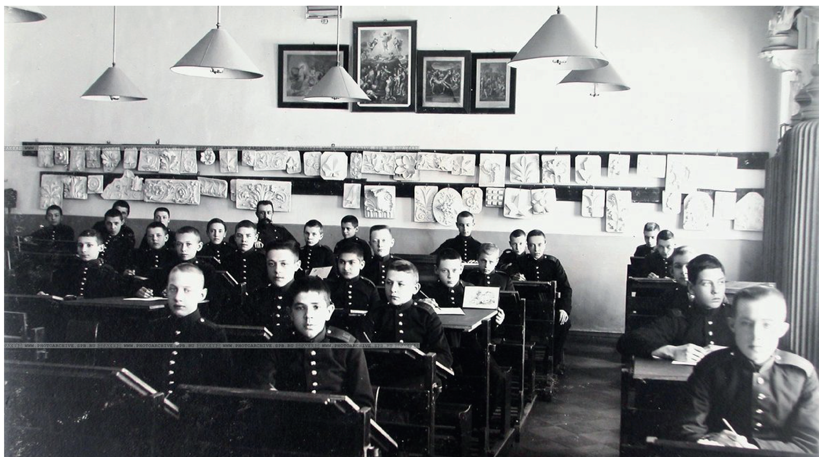
Воспитанники Первого кадетского корпуса в кабинете рисования. 1901г.

В 1882 году была проведена большая реформа военно-учебных заведений, а в начале XX века в связи с увеличением населения на окраинах империи были основаны кадетские корпуса в Ташкенте и Хабаровске, также появились новые корпуса и в центральных губерниях.