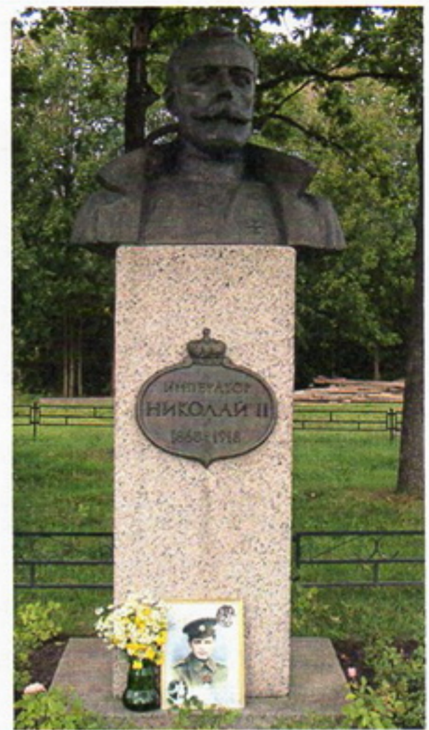
Памятник Николаю II с портретом его сына возле Феодоровского Государева собора в Царском Селе

Индивидуализированный инстинкт восстал против духа, не внял его призывам, отверг его заветы и предпочёл (как говорили тогда) «похабный мир» и всенародный имущественный передел.