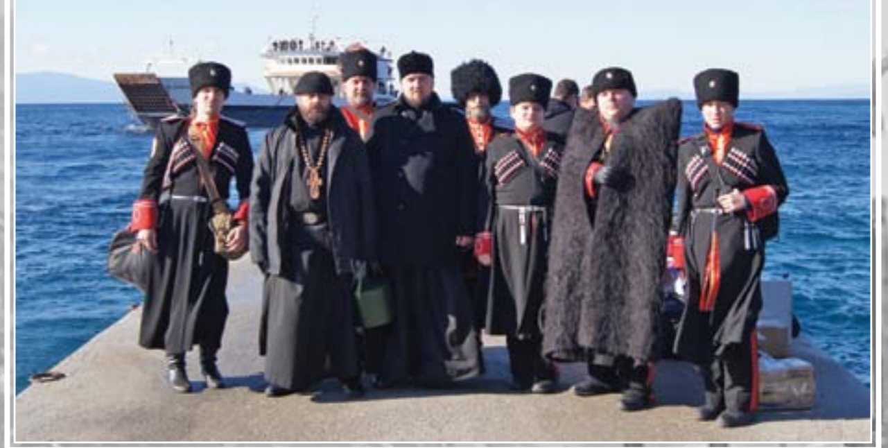
Святая гора Афон. Праздник Крещения Господня, 2012 г.