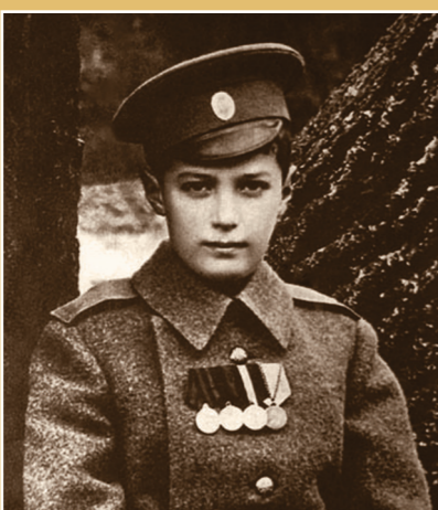
Ершартер Русской Армии Цесаревич Алексей Романов