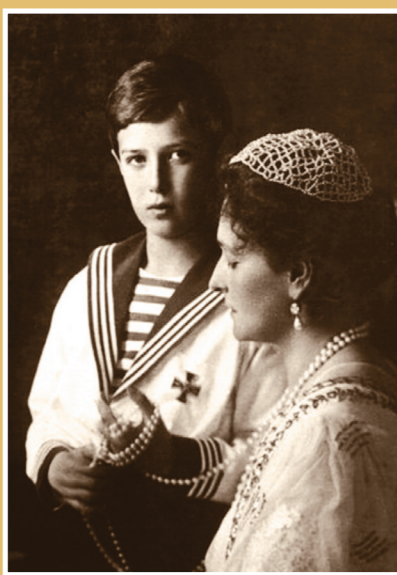
Государь Александр Александрович с Сестрицей Аликсой