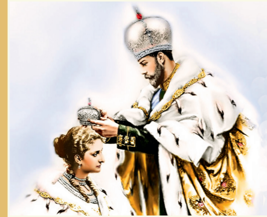
Возложение короны. Худ. Е. Савицкий-Сидоровский