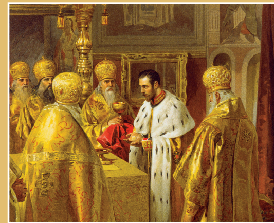
Коронация Царя Николая II в Алтаре. Худ. К. Лебедев

Русский Царь — единственный Царь на Земле, которому вручена от Бога задача охранять Святую Церковь и нести великое царское послушание до Второго Пришествия Христова. Русский Царь — это Богом поставленный Удерживающий, действием которого до времени сдерживалась сила врага человеческого. И в том духовная преемственность от Византийской Империи — II Рима, — к Царской России — III Риму!