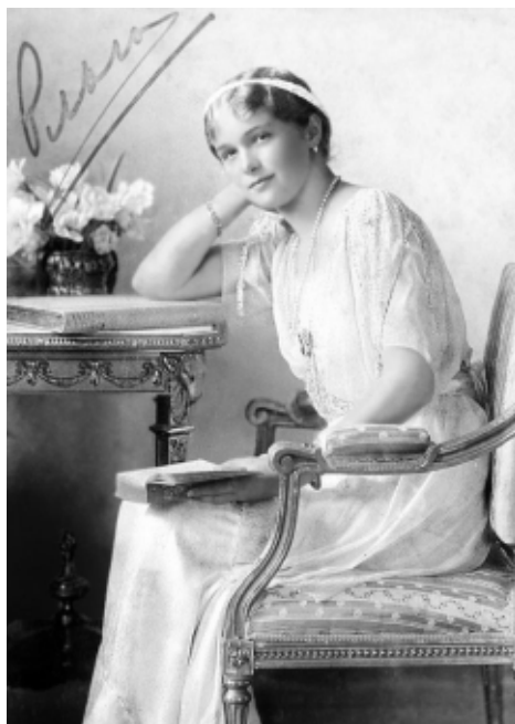
Великая княжна Ольга Николаевна Романова (1895 - 1918 г.г.)

проникнут глубокой верой в свое призвание. Над царской четой было совершено Таинство миропомазания — в знак того, что как нет выше, так и нет труднее на земле царской власти, нет бремени тяжелее царского служения, Господь... даст крепость царем нашим (1 Цар. 2,10). С этого мгновения Государь почувствовал себя подлинным Помазанником Божиим. С детства обреченный России, он в этот день как бы повенчался с ней.