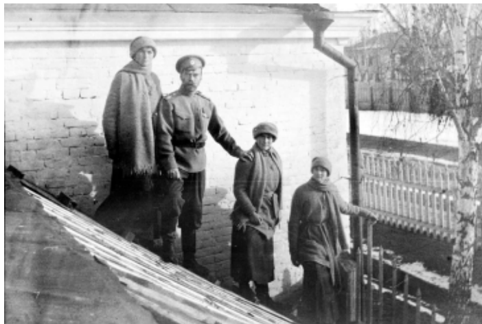
Император Николай II с дочерьми. г. Тобольск 1917-18 г.г.

Как я счастлива, что мы не за границей, а с ней [Родиной] все переживаем. Как хочется с любимым большим человеком все разделить, все пережить и с любовью и волнением за ним следить, так и с Родиной. Я чувствовала себя слишком долго ее матерью, чтобы потерять это чувство, — мы одно составляем, и делим горе и счастье. Больно она нам сделала, обидела, оклеветала... но мы ее любим все-таки глубоко и хотим