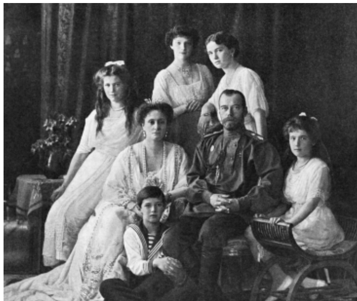
Царская семья (1913 г.)

С самого начала своего правления державой Российской Император Николай II относился к несению обязанностей монарха как к священному долгу. Государь глубоко верил, что и для стомиллионного русского народа царская власть была и остается священной. В нем всегда жило представление о том, что Царю и Царице следует быть ближе к народу, чаще видеть его и больше доверять ему.