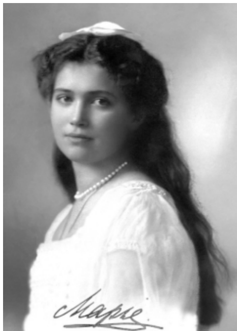
Великая княжна Мария Николаевна Романова (1899 - 1918 г.г.)

К великой скорби Государя, торжества в Москве были омрачены катастрофой на Ходынском поле: в ожидавшей царских подарков толпе произошла давка, в которой погибло много людей. Став верховным правителем огромной империи, в руках