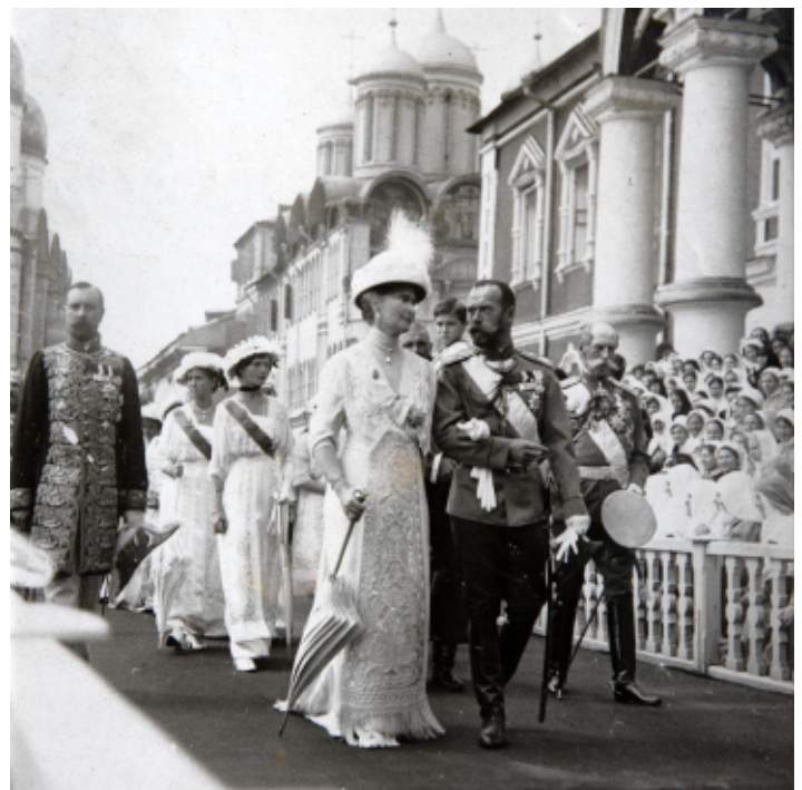
Участие царской семьи в торжествах посвященных 300-летию царствования дома Романовых 21 февраля (6 марта) 1913 года.

По отношению к матери дети были полны уважения и предупредительности. Когда Императрице нездоровилось, дочери устраивали поочередное дежурство при матери, и та из них, которая в этот день несла дежурство, безвыходно оставалась при ней. Отношения детей с Государем были трогательны — он был для них одновременно царем, отцом и товарищем; чувства их видоизменялись в зависимости от обстоятельств, переходя от почти религиозного поклонения до полной доверчивости и самой сердечной дружбы.