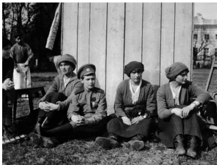
Дети семьи Романовых отдыхают после работ в саду. Царское Село 1917 г.

членов Царской семьи — да, все они страдали, отмечает он, но вместе со страданиями возрастали их терпение и молитва. В своих страданиях стяжали они подлинное смирение — по слову пророка: Скажи царю и царице: смиритесь... ибо упал с головы вашей венец славы вашей (Иер. 13, 18).