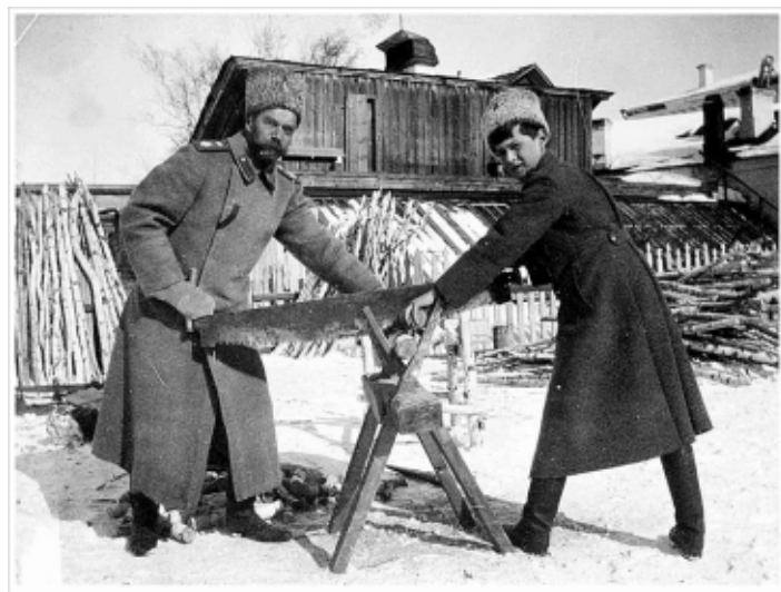
Император Николай II и Цесаревич Алексей занимаются любимым делом - пилят дрова г. Тобольск 1917-18 г.г.