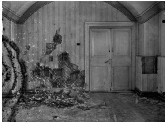
Комната в подвале, где зверски были убиты, без суда и следствия, узники ипатьевского особняка. На стенах видны следы от пуль палачей.

В ночь с 16 на 17 июля, примерно в начале третьего, Юровский разбудил Царскую семью. Им было сказано,