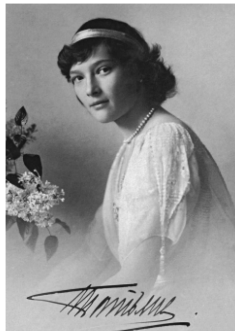
Великая княжна Татьяна Николаевна Романова (1897 - 1918 г.г.)

Долгожданное событие произошло 12 августа 1904 года, через год после паломничества Царской семьи в Саров, на торжества прославления преподобного Серафима. Казалось, начинается новая светлая полоса в их семейной жизни. Но уже через несколько недель после рождения Царевича Алексия выяснилось, что он болен гемофилией. Жизнь ребенка все время висела на волоске: малейшее кровотечение могло стоить ему жизни. Страдания матери были особенно сильны...