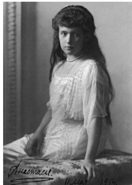
Великая княжна Анастасия Николаевна Романова (1901 - 1918 г.г.)

Однако личная религиозность Государя Николая Александровича, и в особенности его супруги, была чем-то бесспорно большим, чем