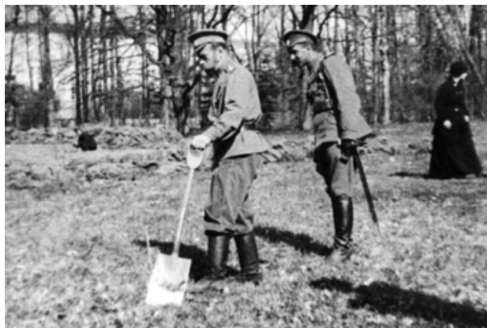
В Царском Селе устроили огород. Работали все: царская семья, приближенные и прислуга дворца. Помогали даже несколько солдат караула 1917 г.

Не остается без его внимания и душевное состояние