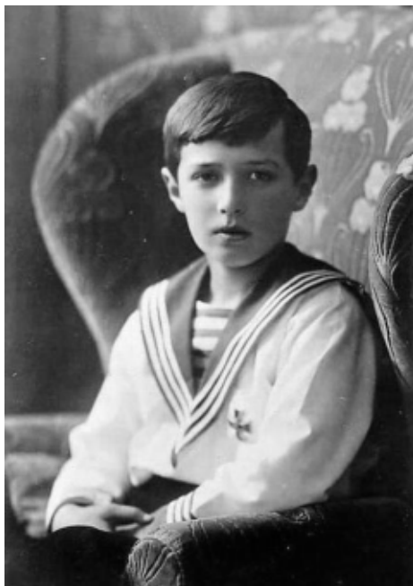
Наследник Цесаревич и Великий князь Алексей Николаевич Романов (1904 - 1918 г.г.)

И одной из важнейших своих обязанностей почитал Государь хранение веры православной, по слову Священного Писания: «царь... заключил пред лицом Господним завет — последовать Господу и соблюдать заповеди Его и откровения Его и уставы Его всего сердца и от всей души» (4 Цар. 23, 3). Через год после свадьбы, 3 ноября 1895 года, родилась первая дочь — Великая княжна Ольга; за ней последовало появление на свет трех полных здоровья и жизни дочерей, которые составляли радость своих родителей, Великих княжон Татианы (29 мая 1897 года), Марии (14 июня