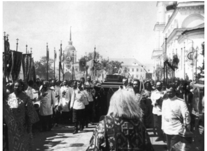
Торжество церковного прославления преподобного Серафима. В нем приняла участие вся царская семья и тысячи людей со всех концов России. (г. Саров 19 июля (1 августа) 1903 г.)

В неофициальной обстановке с Государем общались немногие. И все, кто знал его семейную жизнь не понаслышке, отмечали удивительную простоту, взаимную любовь и согласие всех членов этой тесно сплоченной семьи. Центром ее был Алексей Николаевич, на нем сосредотачивались все привязанности, все надежды.