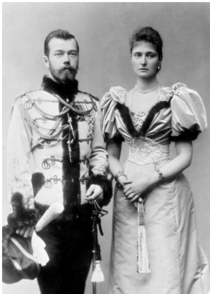
Император Николай II и императрица Александра Феодоровна (1896 г.)

Вера в Бога и святость твоего царского долга да будет для тебя основой твоей жизни. Будь тверд и мужествен, не проявляй никогда слабости. Выслушивай всех, в этом нет ничего позорного, но слушайся самого себя и своей совести».