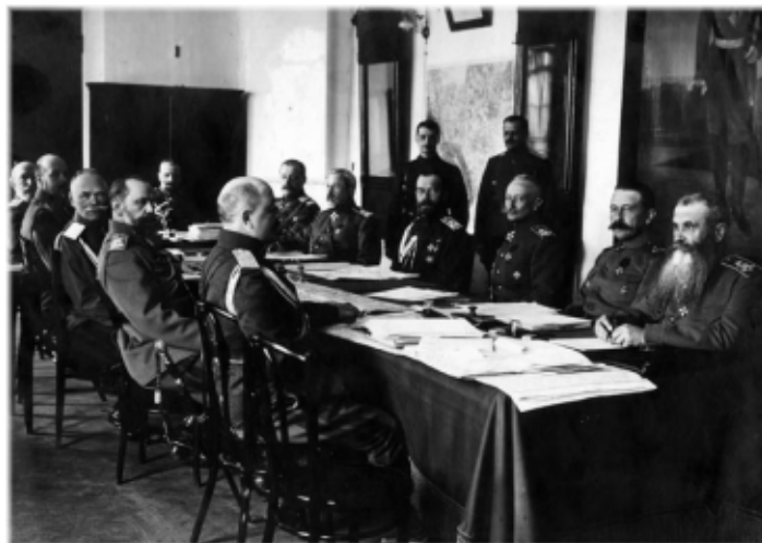
Император Николай II и командующие фронтами на заседании Ставки

Сама Александра Феодоровна занялась политикой не из личного честолюбия и жажды власти, как об этом