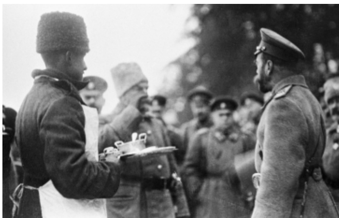
Император Николай II пробует солдатский обед

тогда писали. Единственным ее желанием было быть полезной Государю в трудную минуту и помогать ему своими советами. Ежедневно она отправляла в Ставку подробные письма-донесения, что хорошо было известно министрам.